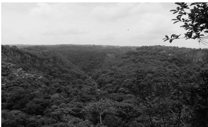
Figura 3. La barranca, vista panorámica desde el bordo.

en un obstáculo, con el progreso del uso del automóvil y de las carreteras pavimentadas. Actualmente constituye una barrera infranqueable en la topografía (véase figura 3), que ha convertido Chavarrillo en un pueblo sin salida, ya que tiene una sola vía de acceso pavimentada (véase figura 1). La situación actual de la barranca contrasta entonces fuertemente con la actividad notable que existía anteriormente, como lugar de cultivo, de convivencia y de paso.