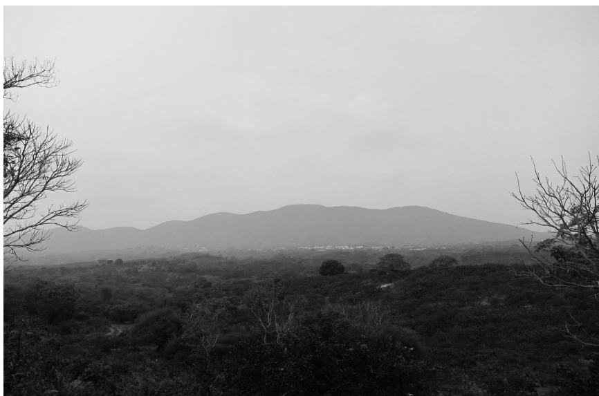
Figura 4. El cerro Tepeapulco y Chavarrillo, desde el llano.

ser considerada como parte del cerro por una población que se acerca cada vez menos a estos lugares. En cuanto a la tierra de uso común, lotificada para transformarse en fraccionamiento, está considerada de manera pragmática por los campesinos y otros habitantes. Los que tenían bestias todavía lamentan su división, pero la mayoría considera que eran tierras con poco uso para los cultivos y deterioradas para la ganadería. La caza se abandonó también después del año 2012, para no asustar a los posibles compradores de lotes y a los que ya los adquirieron y vienen en familia los fines de semana a “pasar un rato” y mantenerlos limpios. El paso de un lugar comunitario y de recreo, emblemático del funcionamiento solidario del ejido pero utilizado de manera estacional y extensiva, a un lugar de provecho económico y fuente importante de beneficios individuales, ha sido aceptado con satisfacción por unos, con resignación por otros, como señal del paso inexorable de los tiempos.