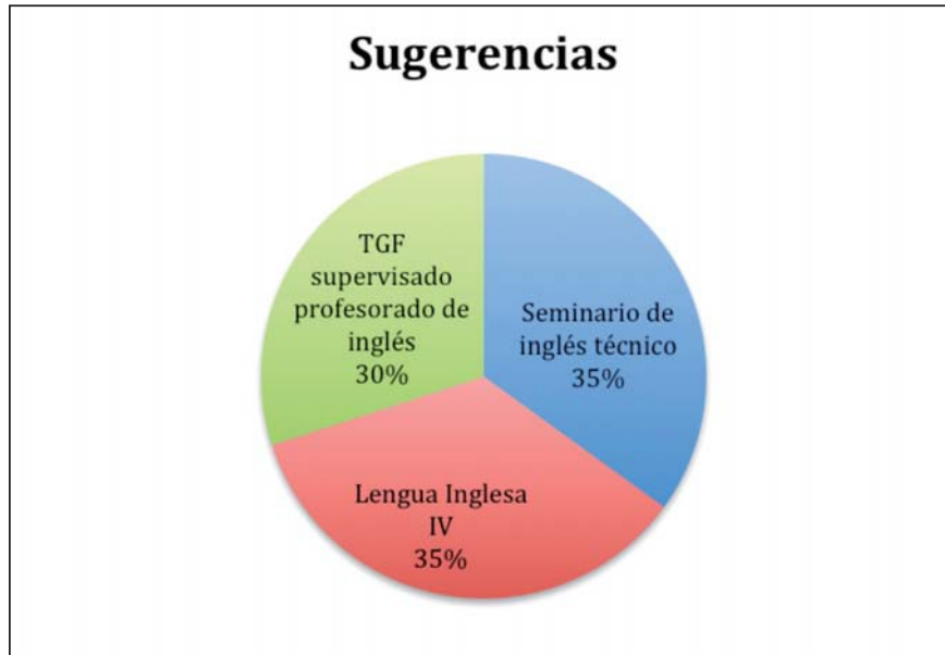
Gráfico 5. Distribución de sugerencias aportadas por el alumnado

Las sugerencias dadas, aunque eran variadas, coincidían básicamente con tres posibles alternativas: