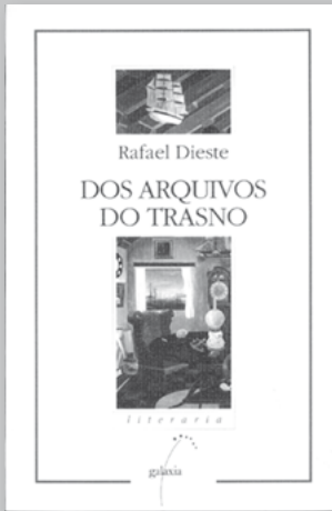
Dos arquivos do trasno de Rafael Dieste, cuberta da edición de 2001