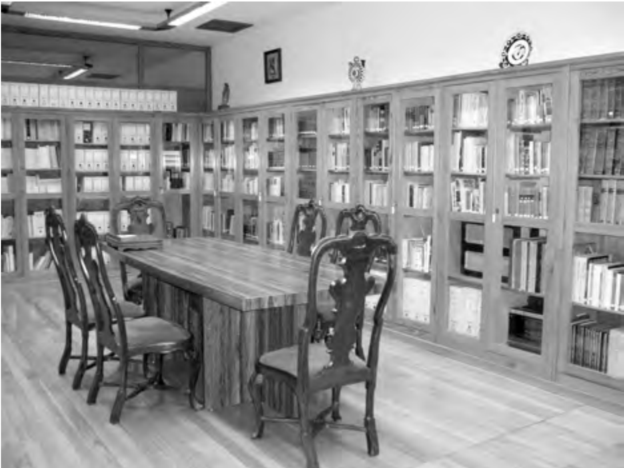
Vista xeral da Biblioteca de Xaquín Lorenzo no Museo do Pobo Galego