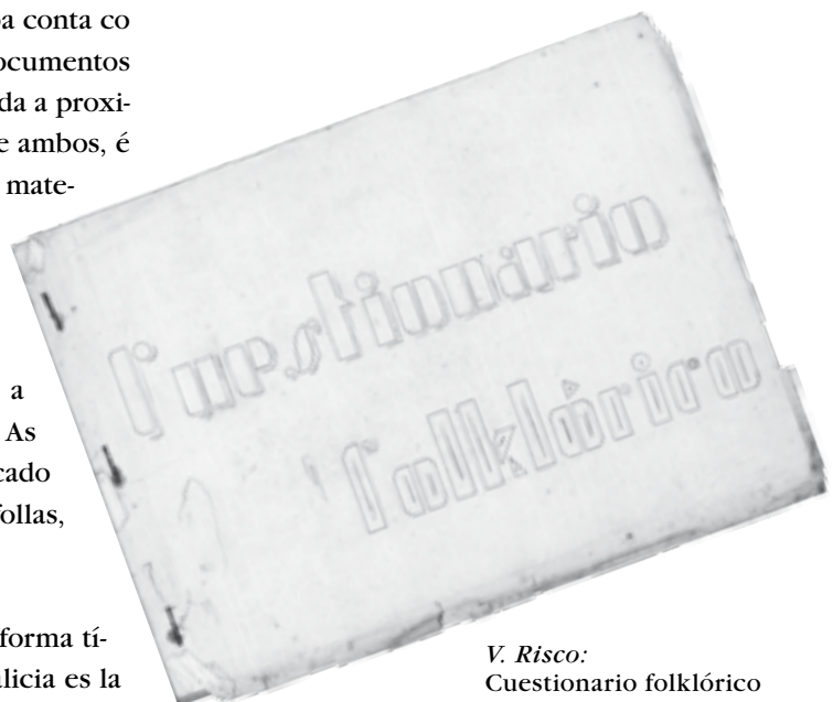
V. Risco: Cuestionario folklórico