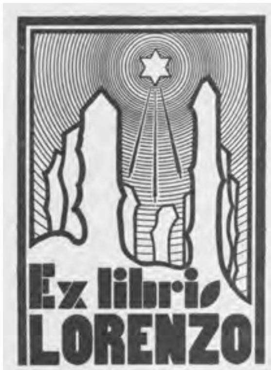
Ex-libris X. Lorenzo

A Estadea ou Pranto polo Seminario de Estudos galegos é un manuscrito de 2 follas, escritas polas dúas caras, e que remata cuns debuxos de temática funeraria: uns cipreses, unha tumba e unha caveira.