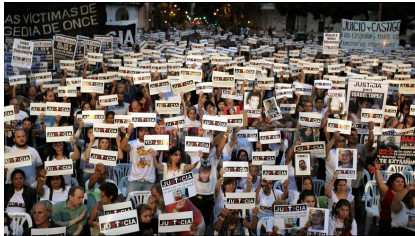
Imagen 3: Acto a los tres años de la tragedia de Once en Plaza de Mayo. Sistema ferroviario de pasajeros de la RMBA. 2015.