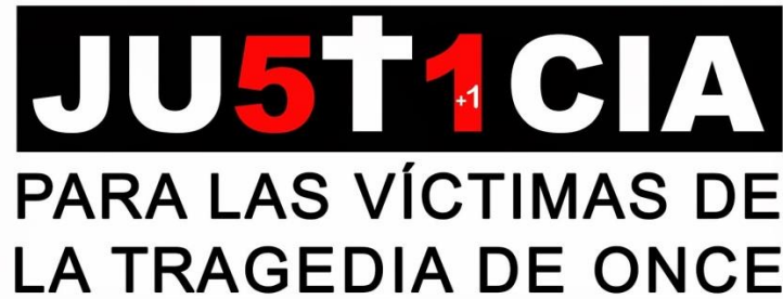
Imagen 2: Logo del movimiento de Familiares de las Víctimas de Once. Sistema ferroviario de la RMBA. 2016.