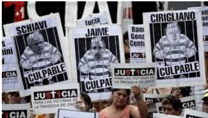
Imagen 4: Acto a los tres años de la tragedia de Once en Plaza de Mayo. Sistema ferroviario de pasajeros de la Región Metropolitana de Buenos Aires. 2015.

Imagen tomada a los tres años de la tragedia de Once.