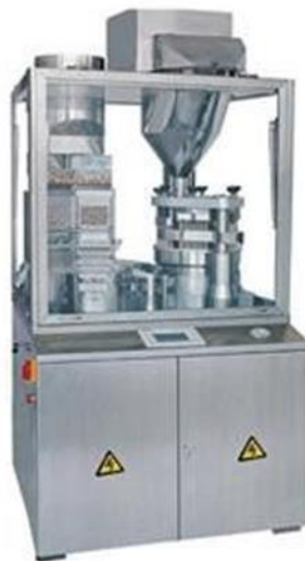
Figura. 5 Máquina llenadora de cápsulas de gelatina dura