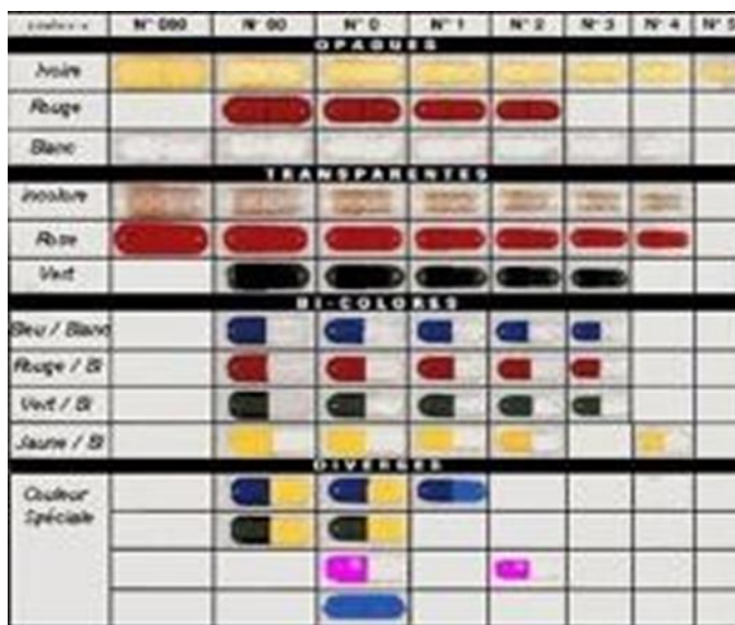
Figura 2. Tamaño de cápsulas fabricación de cápsula de gelatina dura

Diseño de una máquina encapsuladora automática de comprimidos de gelatina dura de 500 miligramos