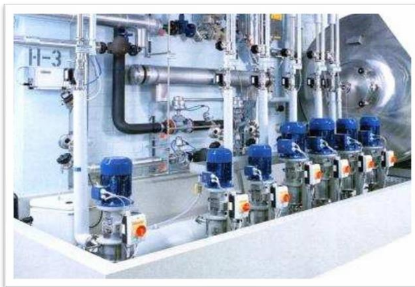
Figura 1. Industria farmacéutica

Diseño de una máquina encapsuladora automática de comprimidos de gelatina dura de 500 miligramos