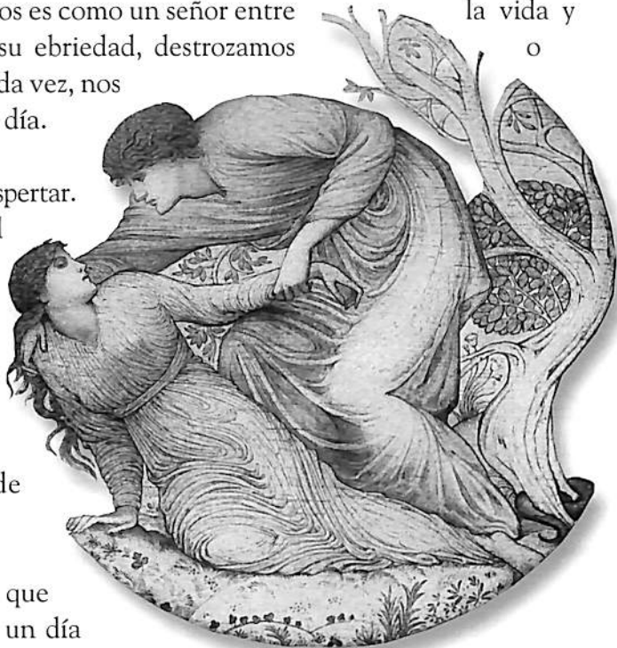
Burne-Jones, Orpheus: The Garden Poisoned (Eurydice has been bitten by a snake).

ORFEO.- Tonta. Menos mal que contigo se puede hablar. Tal vez un día serás como un hombre.