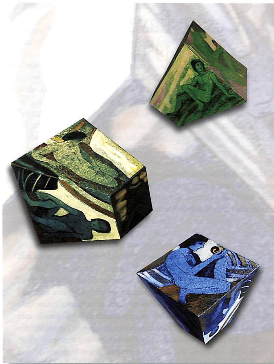
Alejandro Quijano, El juego del espacio , 2009, instalación técnica mixta.