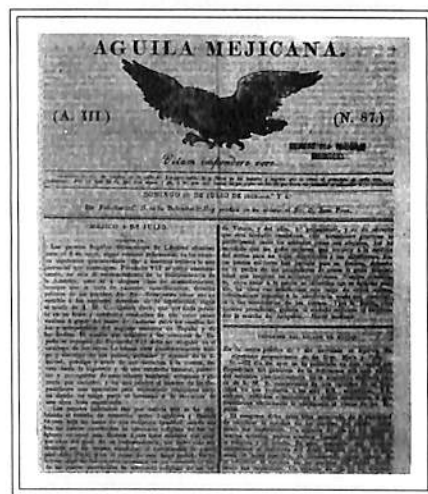
PORTADA DE EL ÁGUILA MEXICANA.

El 2 de abril de 1813 fundó, en Mérida, Yucatán, el que fuera el segundo periódico de la península al que llamó El Aristarco Universal , publicación de carácter "crítico, satírico e instructivo". Apareció semanalmente durante 37 números, de los que sólo se conserva el último, del viernes 17 de diciembre de 1813. A partir del 20 de mayo de ese año, también editó el semanario titulado El Redactor Meridiano , del que se hicieron 32 ediciones. En 1820, de mayo a julio, publicó El Hispano-Americano Constitucional , periódico "filosófico" de Yucatán. Ese mismo año, en octubre y a su paso por La Habana, Cuba, rumbo a las Cortes de España, publica un folleto atacando a las autoridades yucatecas titulado: Pruebas de la estención del Despotismo o idea del estado actual de la capital de Yucatán . En julio de 1824 tradujo un artículo de De-Pradt, Arzobispo de Malinas, sobre "Las funestas consecuencias del regreso de Iturbide" y lo editó en El Sol , diario de la Ciudad de México.