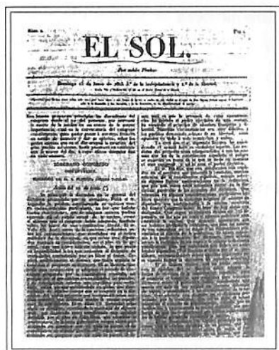
PORTADA DE EL SOL.

El Sol , México, D.F. 5 de julio de 1826. “Artículo Contra el Derecho del