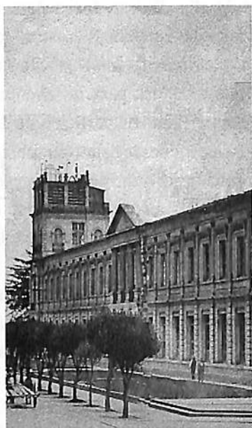
ANTIGUO INSTITUTO LITERARIO. DETALLE.

Propuso además la creación de un banco nacional, pero no le fue aceptada. De 1825 a 1826 es senador de la República por el Estado de Yucatán y, el 1 de mayo de 1826, se le designa como Presidente de la Cámara de Senadores. En 1825 participa en la fundación de una nueva logia masónica, la del rito de York, junto con Poinsett, Miguel Ramos Arizpe y Vicente Guerrero.