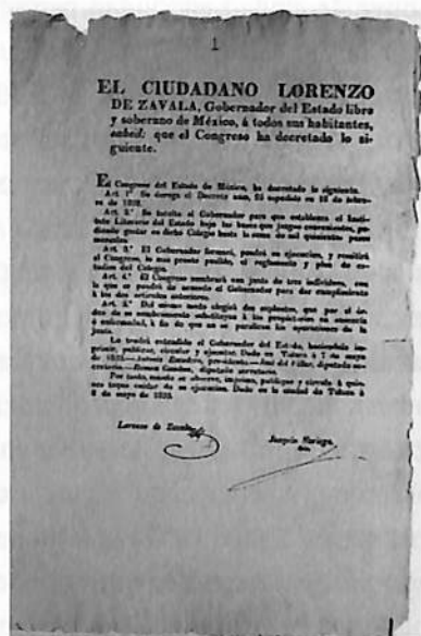
BANDO DE 1833, FIRMADO POR LORENZO DE ZAVALA, MEDIANTE EL CUAL SE FACULTA AL GOBIERNO DEL ESTADO PARA RESTABLECER EN TOLUCA EL INSTITUTO LITERARIO DEL ESTADO DE MÉXICO.

El 5 de octubre de 1835, siendo presidente interino de México Miguel Barragán, Zavala se reúne con Houston, Johnson y Austin para marchar contra el ejército mexica-