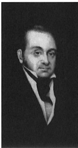
LORENZO DE ZAVALA

Regresa Zavala de Europa, en 1821, después de la firma de los Tratados de Córdoba. El 30 de marzo de 1822 jura como diputado por Yucatán en el Soberano Congreso Constitucional convocado por Agustín de Iturbide, para organizar la monarquía moderada en el nuevo país. En julio de ese mismo año, se crea la Comisión para el Estudio de