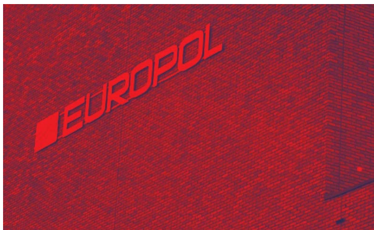
Imagen 2.

El terrorismo yihadista representa una gran amenaza para las sociedades europeas que –en los últimos meses– se han visto muy perturbadas por diversas acciones de este tipo de terrorismo.