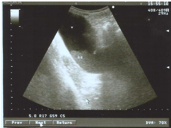
Figura 4. U/S hipocondrio derecho: corte oblicuo se observa vesícula marcadamente dilatada de paredes finas con bilis de éctasis en interior ocupando el 50 % de ella.

No eco Murphy, con bilis de éctasis que ocupa 50 % de la misma. (Figura 4).