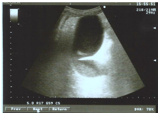
Figura 3. U/S hipocondrio derecho: corte oblicuo se observa vesícula marcadamente dilatada de paredes finas sin imágenes de litiasis en su interior.

La vesícula marcadamente dilatada de paredes finas sin imágenes de litiasis en su interior. (Figura 3).