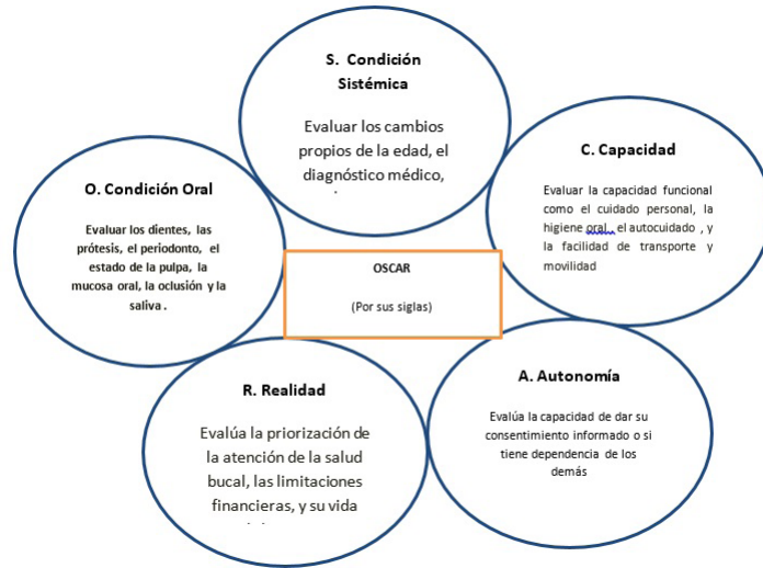
Figura 3. Los cinco aspectos que valoran la condición del anciano, propuestos por la Escuela Norteamericana

Después de tener un panorama claro del tipo de paciente que se tiene, los criterios mencionados anteriormente se deben organizar teniendo en cuenta 4 factores dominantes para enfocar las prioridades del manejo de las necesidades odontológicas en pacientes ancianos, las cuales Berkey y col (23,24) categorizan en su orden: Función, patología, sintomatología y estética. (Tabla 2.) Sin embargo, diferimos del orden propuesto por Berkey, considerando que la sintomatología podría ocupar el primer lugar en los pacientes ancianos ya que en esta etapa se prioriza el bienestar en manejo de dolor y la infección; seguido de la función, la patología y la estética. En los pacientes con demencia el orden podría resultar alterado por la dificultad que tendrían las personas mayores de relatar sus propios síntomas. Iniciando entonces por patología, seguido de función y terminando con estética cuando no sea posible evidenciar los síntomas.