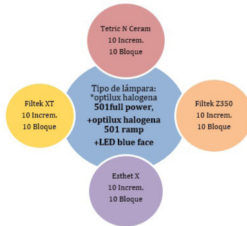
Figura 1. Distribución de muestras