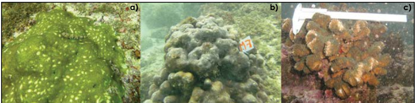
Figura 2. Marcas de mordidas de peces en corales de los géneros más abundantes en el litoral del Pacífico mexicano: a) Porites , b) Pavona y c) Pocillopora . Islas Marietas, Nayarit.

De las 1,305 mordidas registradas, el porcentaje de imperceptibles fue de 7.12% para Porites , 9.43% para Pocillopora y 6.01% para Pavona . De las tallas medianas —que presentaron los mayores