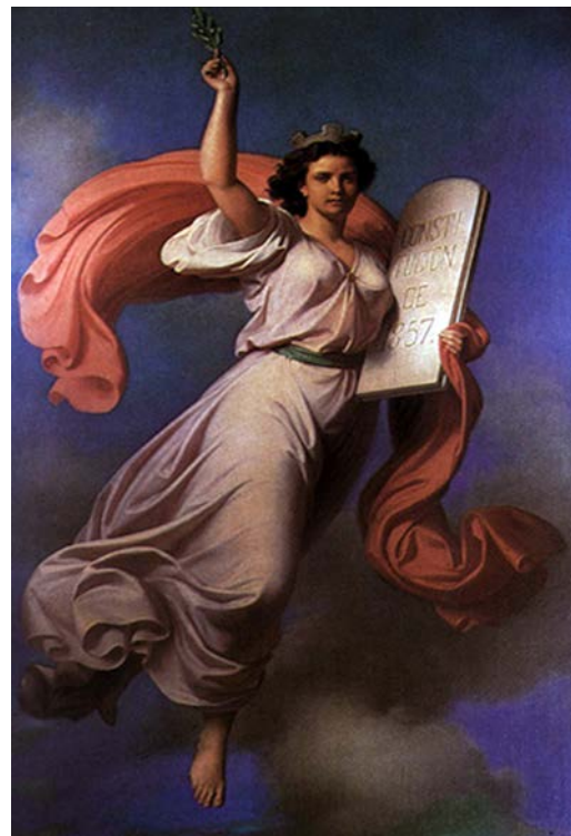
Figura 2. Petronilo Monroy, Alegoría de la Constitución de 1857 , 1868. Palacio Nacional. Imagen de Monroy (1868).

Ante la guerra que se produjo por el rechazo de los conservadores a la Constitución, los liberales radicales decidieron avanzar en la transformación jurídica y social del país y promulgaron en los años siguientes las Leyes de Reforma. Con ellas, la libertad de enseñanza adquirió un entorno jurídico que dio mayor alcance a la nueva Norma fundamental, en especial por el principio de la separación del Estado y la Iglesia, que afirmó la soberanía del primero y la supremacía de la Constitución. La libertad de enseñanza, apoyada en la laicidad del nuevo