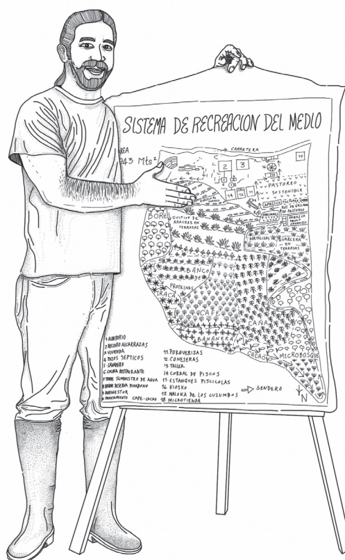
Figura 1. Ilustración de Hernando Hincapié y plan de la Granja de Mamá Lulú. Fuente: Sergio Perea R., ilustraciones para el estudio de caso: Eco+Granja , 2015. Ilustración digital en iPad (180815): App Express Sketch Book X.

La metodología de estudio para valorar unidades del paisaje cultural en contextos rurales requirió diversas técnicas de conocimiento científico como estrategia para el reconocimiento de los significados culturales y la evaluación de los atributos de su arquitectura. De esta manera, los procedimientos especiales de investigación involucran la percepción espacio-temporal y el análisis sistémico de la arquitectura de la granja agroecológica .