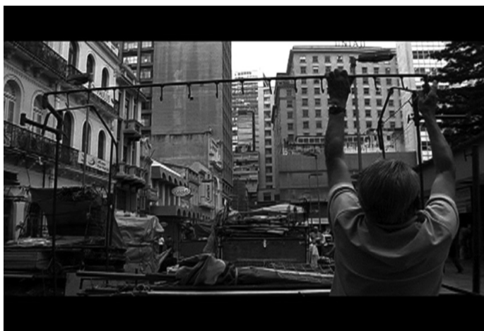
Figura 3: Diariamente.