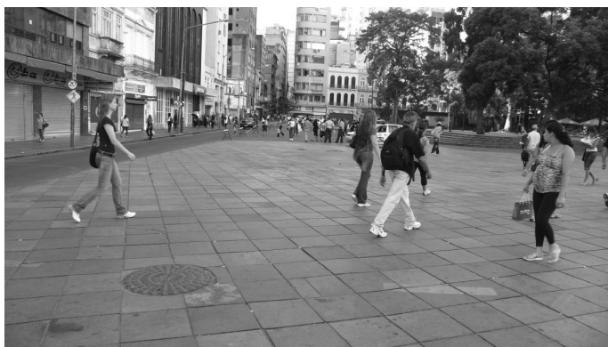
Figura 8: O Largo depois da saída do Camelódromo da Praça XV.

Não se pode dizer também, que o ‘final feliz’ seja a volta do Camelódromo para Praça XV, afinal a existência na informalidade-ambulante parece ser um permanente flutuar – arriscado - na incerteza. Curiosamente, no entanto, esses pequenos empreendimentos, espontâneos e auto-organizados, parecem expressões de uma positiva transformação social, na medida em que superam a desagregação e o caos da vida urbana, e criam laços fortes e solidários, baseados na palavra e no respeito. Assim, diante de todo o quadro de políticas, muitas vezes irresponsáveis, resta lembrar não ser esta a primeira vez na história em que a caça ao camelô acontece. E os comerciantes da rua , ainda que não as mesmas pessoas, voltaram muitas vezes a ocupar as mesmas calçadas de onde foram uma vez retirados, e voltaram a anunciar em voz alta as promoções, e a usar, à luz do dia, da malandragem e da criatividade típicas da nossa cultura popular.