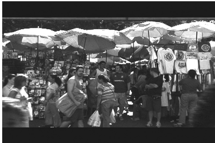
Figura 6: O Camelódromo e suas passagens.

Qual será o valor da banca de Alemão da Rifa ? De acordo com suas lembranças, era o preço de todas as relações costuradas ao longo dos anos; na vida incerta da Pedra , isso parece ser definitivo. Nesse sentido, Varela (MATURANA; VARELA, 2001, p. 32) observa: "É no domínio da relação com o outro, na linguagem, onde se passa o viver humano; e é, portanto, no domínio da relação com o outro, onde tem lugar a responsabilidade e a liberdade com modos de conviver". Daí depende-se que viver em coletivo, em sociedade, é por definição tarefa complexa; no caso dos ambulantes, no entanto, saber conviver com o diferente era parte intrínseca e fundamental da atividade (Figura 6).