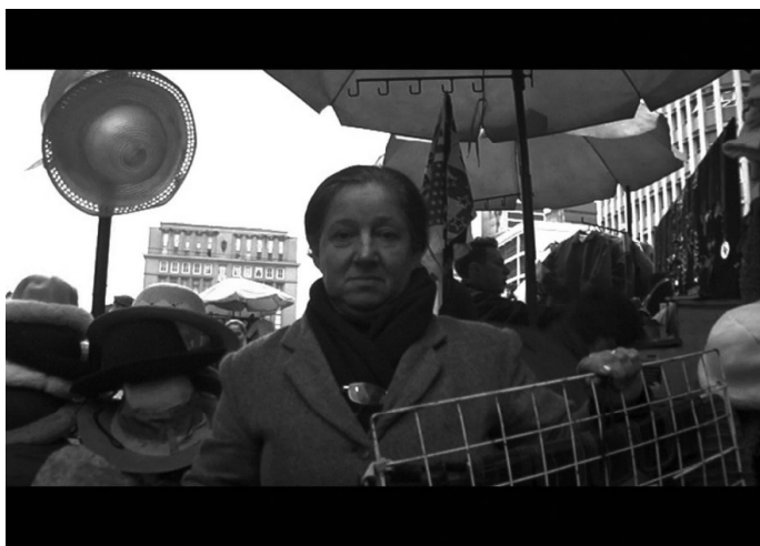
Figura 4: Anos de Pedra.

Na Praça XV, dos camelôs mais antigos, diz-se que têm anos de pedra .