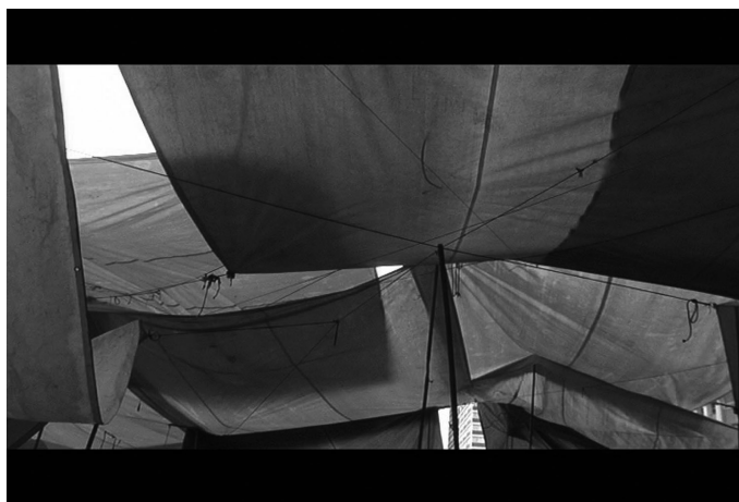
Figura 7: Lonas.

O Camelódromo, durante 40 anos de vida, constituía uma unidade; na afirmação não há uma idealização utópica, mas a constatação de uma rede social fortemente entrelaçada que espontaneamente aprendeu a viver em coletivo. Nesse processo, a necessidade de um desencadeia automaticamente a mobilização dos outros. Parte inseparável dessa coesão era o modo de comunicação; ali, em questão de minutos, qualquer notícia se espalhava; fofoca, conversa fiada, não importava o nome, mas que as palavras se propagassem e atingissem a quem interessava atingir. Essa era também uma maneira de se proteger e se preservar em um jeito de viver incerto, ambulante, mutante. Em sua sinceridade visceral, com pouquíssimas palavras, Alemão da Rifa fazia desmoronar qualquer visão romântica sobre a existência do camelô: