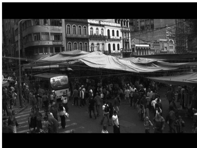
Figura 1: A grande instalação.

Formado ao longo de quatro décadas, o Camelódromo da Praça XV (Figura 1) se desenvolveu como um sistema social complexo; uma rede intrincada de conversações, gestos, rotinas, tecnologias e narrativas. Uma cultura que se organizou, se adaptou e se transformou em uma gigantesca instalação; um cenário vivo, constituído por miríades de lonas, guarda-sóis, prateleirinhas, expositores e mercadorias, na maior parte ligadas à cultura do consumo.