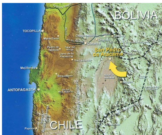
Imagen 1. Llagostera, los antiguos habitantes del Salar de Atacama

Algunos de los recursos turísticos más relevantes de San Pedro de Atacama son: