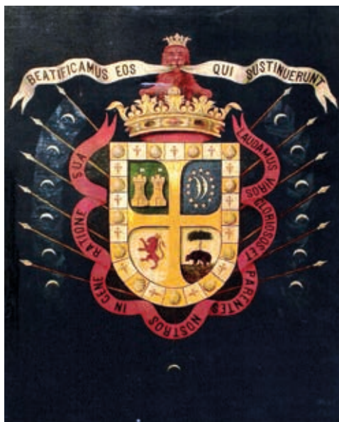
Blasón del Solar de Valdeosera. Jerez de la Frontera (Cádiz).

GENEALOGÍA, por línea agnaticia, desde el más antiguo conocido (el petrucho), hasta el más reciente de ellos, asentado en el Solar de Valdeosera.