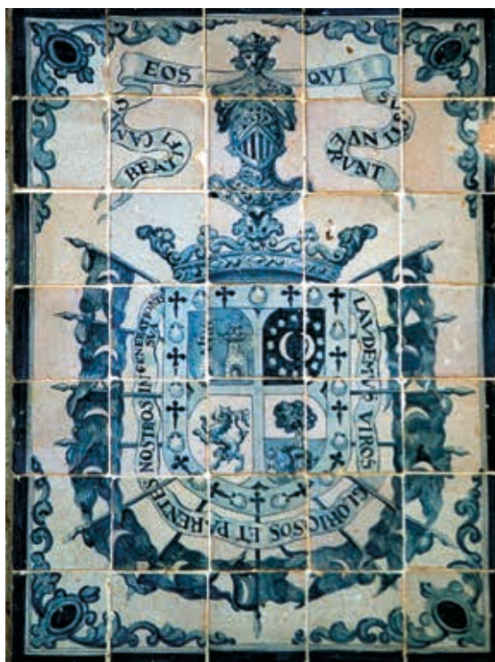
Blasón del Solar de Valdeosera, colocado en el patio del Alcázar.