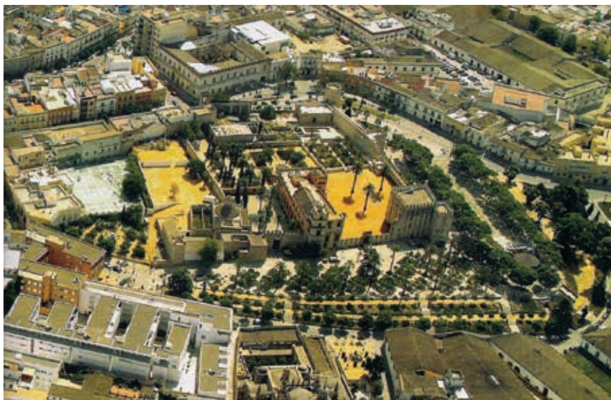
Alcázar de Jerez de la Frontera (Cádiz).