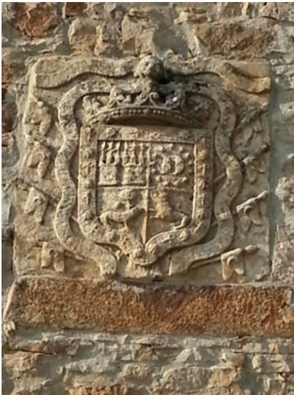
Blasón del Solar de Valdeosera. Cubo de la Sierra. (Soria).