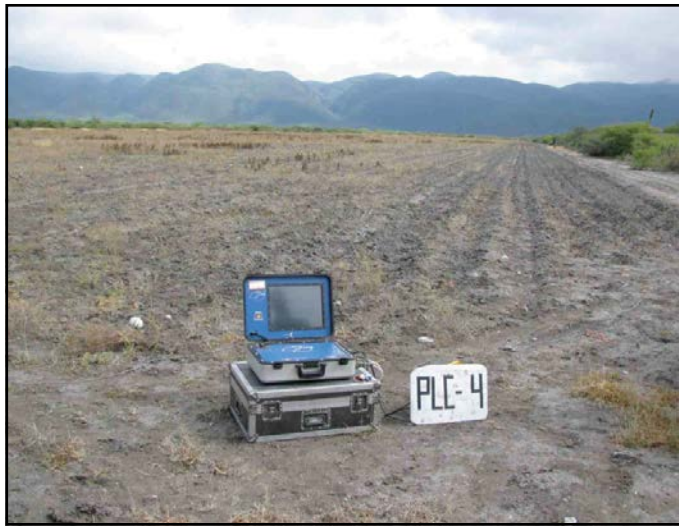
Figura 2. Sondeo electromagnético en el dominio del tiempo realizado en el altiplano de Tula, con el equipo terraTEM y arreglo loop coincidente.