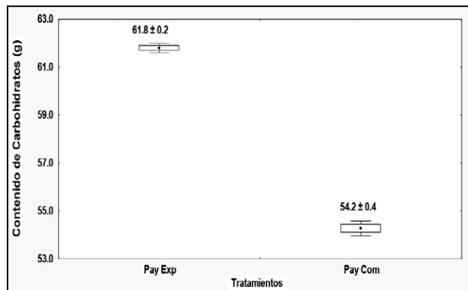
Figura 3. Comparación entre el contenido de carbohidratos del pay experimental y el comercial. Elaboración propia.