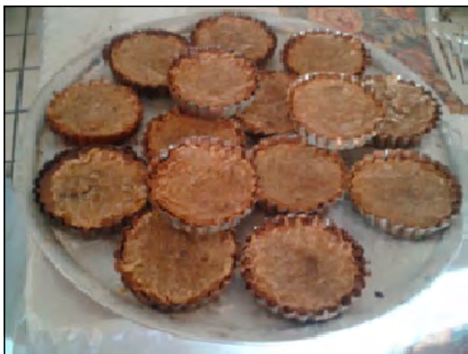
Figura 5. Pay de frijol con mermelada de chilacayote.

Por otra parte, la FAO (2013) menciona que las necesidades de proteínas recomendadas para adultos de 18 años en adelante son de 1. g/kg/d; es decir, si tienen un peso promedio de 65 kg necesitan consumir 65 g de proteína al día. Asimismo, Serrano y Goñi (2004) mencionan que el requerimiento diario de proteína es de 46-50 g para las mujeres (15-50 años) y de 63 g para los hombres (15-50) años.