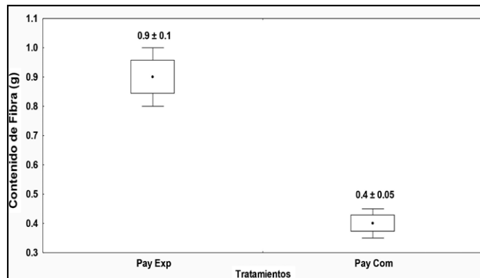
Figura 4. Comparación entre el contenido de fibra del pay experimental y el comercial. Elaboración propia.

significa 12.3% más en el experimental. Sin embargo, se encuentra en los límites permitidos (NOM-247-SSA1-2008). Como puede observarse en la figura 3, se realizó una comparación estadística entre ambos tratamientos y se encontraron diferencias significativas ( p < 0.05 ).