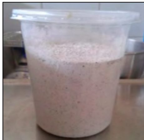
Figura 6. Harina de frijol.

En el trabajo de León Marrou y Villacorta González (2011) se obtuvieron los siguientes resultados: 55.1% de carbohidratos con valor energético de 344.8 kcal/100 g. Por otra parte, Mousa et al. (1992) obtuvieron una aportación de 70.8% (Korsan) y 82.3% (mafrood) de carbohidratos. De la misma manera, la FAO (2013) y Pickut (2013) mencionan que la cantidad de carbohidratos que debe incluir la alimentación de cada persona se estima como un porcentaje del total de calorías. Varían entre 45 y 65% del aporte calórico total. Por ejemplo, si se consumen alrededor