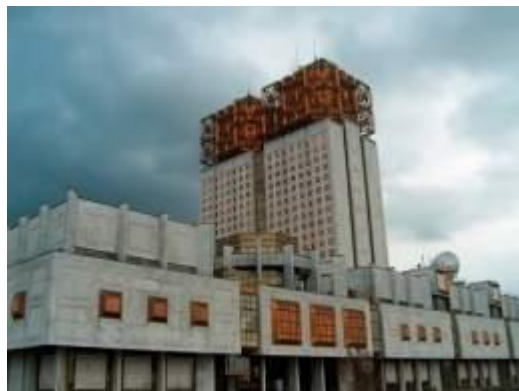
Gráfico 2. Academia de Ciencias de Rusia, en Moscú.

La Academia de Ciencias de Rusia es una organización científica de Rusia, de autogobierno (institución), que tiene carácter oficial. Reagrupa los institutos científicos del país y tiene como objetivo organizar y realizar investigaciones fundamentales. Ha sido renombrada y trasladada durante varias ocasiones en su historia. Actualmente su sede se encuentra en Moscú.