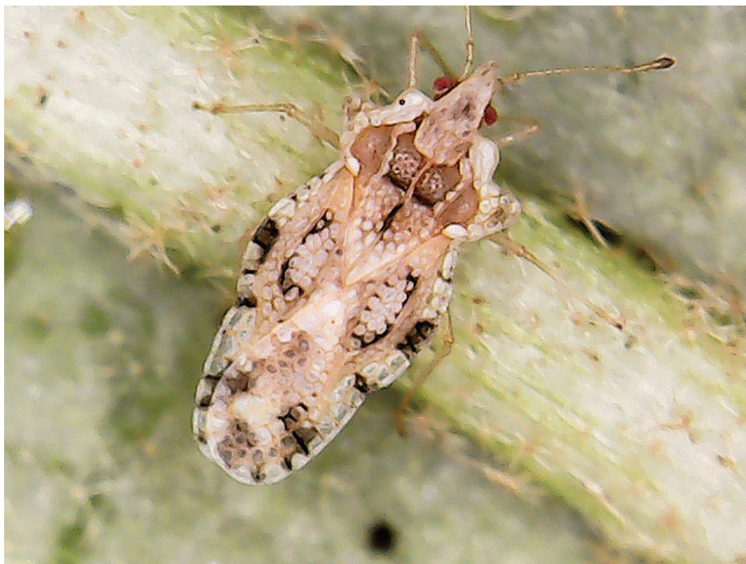
Figura 1. Corythaica passiflorae (Berg) (Hemiptera: Tingidae) em folha de jiló, em cultivo comercial no Município de Paraíso do Tocantins, TO.

A fertilidade do solo possui influência direta no desenvolvimento de plantas e pode afetar indiretamente a densidade populacional de insetos fitófagos (HERZOG & FUNDERBURK 1986; SCHULZE & DJUNIADI 1998). A quantidade de nitrogênio e potássio fornecida às plantas de S. melongena podem influenciar na resistência ou susceptibilidade ao ataque de C. passiflorae . A berinjela é considerada a cultura mais suscetível à C. passiflorae que outras plantas da família das solanáceas (KOGAN 1960; VENTURA et al. 2007).