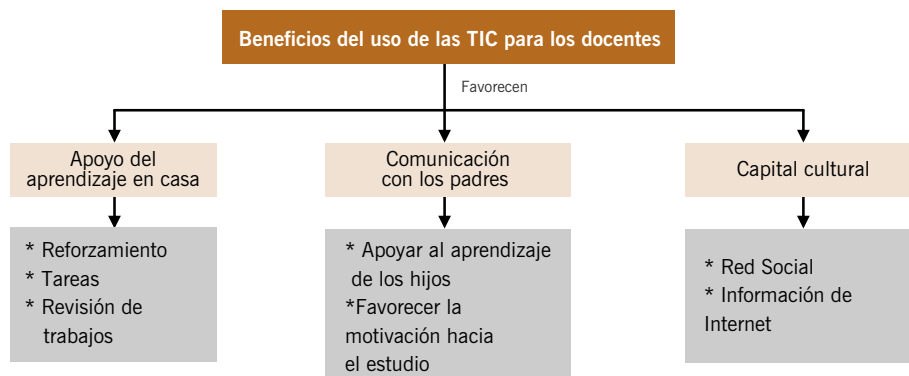
Figura 2. Beneficios de la participación familiar mediante el uso de las TIC

sostienen que las TIC les permiten comunicarse con las familias para abordar el aprendizaje y la conducta de los hijos, lo cual origina mayores sinergias con ellas. Por otra parte, creen que las familias amplían el capital cultural de los estudiantes mediante las TIC y, por ende, desarrollan su aprendizaje: