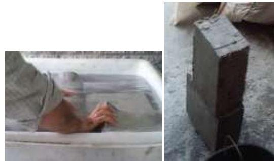
Figura 7 Fundición y curado del ecobloque.

Curado del ecobloque. Luego de la fundición del ecobloque se procedió a humedecerlos con agua para el proceso de curado, (Ver figura 7) para luego realizarles las pruebas de laboratorio a los 7, 14 y 28 días, respectivamente.