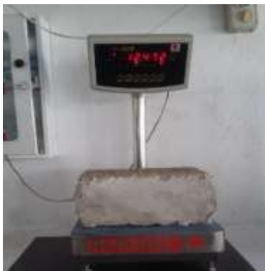
Figura 10 Peso del bloque seco.

Peso seco del prototipo ecobloque. (Ver figura 10) En este proceso se sometió al ecobloque a un secado en el horno para después proceder a realizar las pruebas de laboratorio. Se obtuvo como resultado 12.472 Kg.