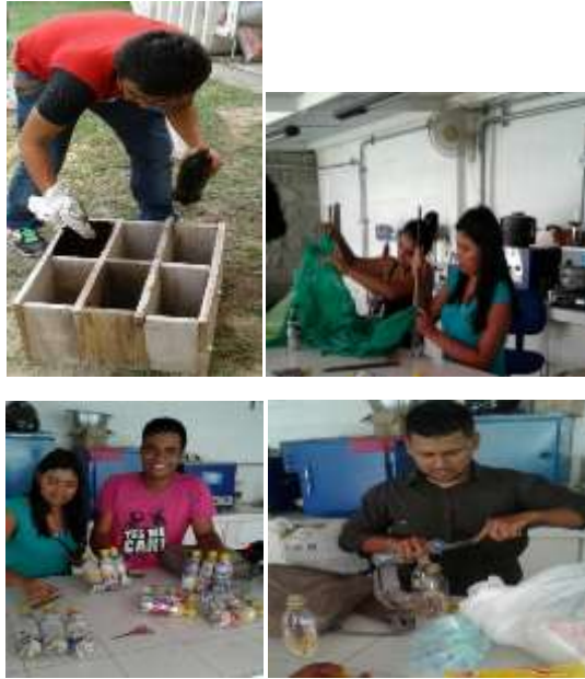
Figura 3 Ilustración del proceso constructivo. Archivo de los autores.

Peso de botellas PET con material. Posteriormente, y luego de llenar las botellas PET en su máxima capacidad, fueron pesadas (Ver figura 4); seguidamente fueron compactadas con una varilla con el fin de lograr uniformidad en cuanto a la cantidad de material utilizado en cada una de ellas; en seguida se amarraron en grupos de 3 botellas con una malla (galpón) para luego ser pesadas en una báscula.