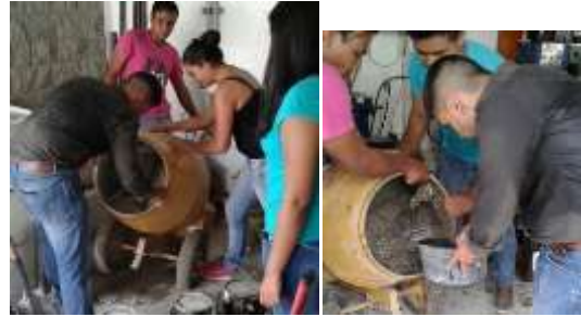
Figura 5 Proceso de mezclado. Mezcla para fundir el ecobloque.

Preparación de mezcla del ecobloque. En este proceso se hizo una mezcla en la que se utilizó grava, arena de peña y cemento. (Ver figura 5) En esta fase se empleó un compuesto químico-físico adicional llamado fibra tuf strand (macro fibra sintética), con el fin de lograr una mayor resistencia y que las moléculas se adhirieran más fácilmente a las botellas PET.