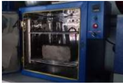
Figura 8 Secado del ecobloque en el horno.

figura 8) con el fin de iniciar la detección de fallas en el material.