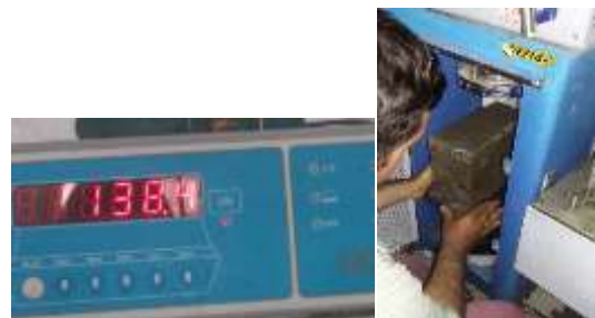
Figura 12 Prueba del ecobloque - 14 días. Resultados de la prueba.

Prueba de compresión para el ecobloque (Tiempo de 14 días). Al realizar la segunda prueba de compresión se observó que la resistencia fue duplicada, situación que favoreció el desarrollo de la investigación pues se obtuvo un resultado de 138 KN fuerza. (Ver figura 12)