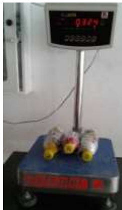
Figura 4 Ilustración del peso de las botellas PET.

Peso de botellas PET con material. Posteriormente, y luego de llenar las botellas PET en su máxima capacidad, fueron pesadas (Ver figura 4); seguidamente fueron compactadas con una varilla con el fin de lograr uniformidad en cuanto a la cantidad de material utilizado en cada una de ellas; en seguida se amarraron en grupos de 3 botellas con una malla (galpón) para luego ser pesadas en una báscula.