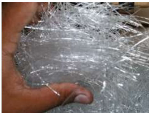
Figura 2 Microfibra sintética estructural.

Peso de macrofibra sintética. Otro componente de gran importancia fue el aditivo, la microfibra sintética. (Ver figura 2) Este material se utilizó gracias a sus características especiales, pues favoreció el proceso al darle mayor adherencia a la mezcla de las botellas PET; situación que ayudó a lograr una resistencia mucho mayor en comparación con los ensayos realizados previamente. Se adicionaron 340 gr. por ecobloque.