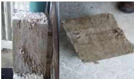
Figura 14 Resultados de la prueba.

Tipo de falla obtenida. En el transcurso de los 3 ensayos preliminares se observó una falla columnar, producto de la distribución heterogénea de las fibras (Ver figura14), aspecto que se fue mejorando en las posteriores pruebas con el fin de alcanzar un resultado favorable con respecto al factor resistencia; de tal forma que se lograra superar lo exigido por la NSR10-NTC 4026 que oscila entre 9 megapascales (91,77kgf/cm 2 ) y 15 megapascales (153 kgf/cm 2 ); resultado que se empezó a evidenciar en esta etapa.