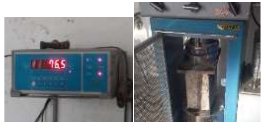
Figura 11 Pruebas de compresión. Resultados de la prueba.

Prueba de compresión para el ecobloque (Tiempo de 7 días). Posteriormente de la toma del peso seco del ecobloque, se realizó una prueba de compresión (Ver figura 11) en la que se observaron fisuras en sus costados, arrojando como resultado en la primera prueba de 76,5 KN fuerza.