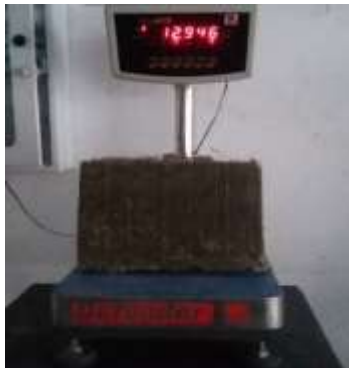
Figura 9 Peso del ecobloque húmedo.

Peso húmedo del prototipo ecobloque. En esta fase se pesó el ecobloque húmedo. (Ver figura 9) Se obtuvo como resultado 12.946 Kg.