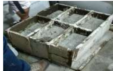
Figura 6 Moldeado del ecobloque.

Fundición del ecobloque. Luego de obtener la mezcla, se procedió a fundir el ecobloque con las botellas PET debidamente acomodadas en su interior; inmediatamente después se fue agregando la mezcla al molde para luego proceder a sacarle los vacíos a cada una de ellas respectivamente con ayuda de una varilla. (Ver figura 6)