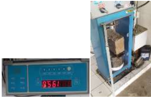
Figura 13 Prueba de compresión a los 28 días. Resultados de la prueba.

Tipo de falla obtenida. En el transcurso de los 3 ensayos preliminares se observó una falla columnar, producto de la distribución heterogénea de las fibras (Ver figura14), aspecto que se fue mejorando en las posteriores pruebas con el fin de alcanzar un resultado favorable con respecto al factor resistencia; de tal forma que se lograra superar lo exigido por la NSR10-NTC 4026 que oscila entre 9 megapascales (91,77kgf/cm 2 ) y 15 megapascales (153 kgf/cm 2 ); resultado que se empezó a evidenciar en esta etapa.