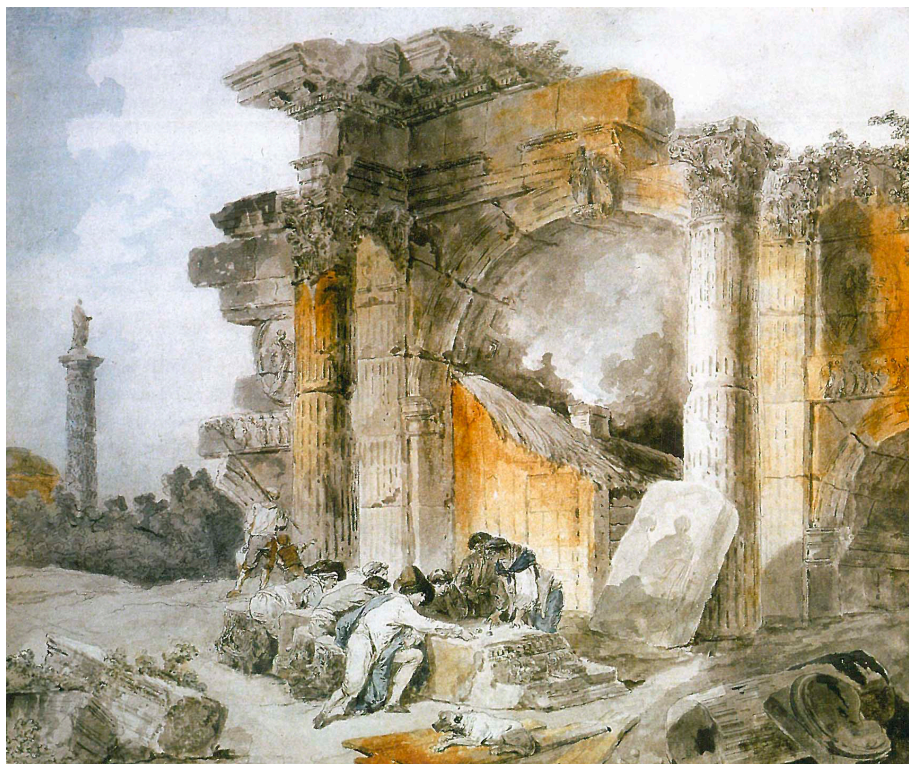
Figura 1 – A Game of Dice Amidst Roman Ruins , ca. 1780s (?) – coleção privada, 40,5 x 49 cm

Pela observação das obras de Robert é possível estabelecer uma relação entre o desenvolvimento e o interesse na preservação do patrimônio que emergiu durante a Revolução Francesa, o tema das ruínas e o regime de historicidade que marcou a compreensão dos sujeitos de si no tempo, influenciando interpretações sobre a experiência temporal daquele contexto. A pintura inacabada A Game of Dice Amidst Roman Ruins 7 (DUBIN, 2010, p. 10) é exemplar nesse sentido. Ela estabelece uma “atitude patrimonial” em seus “dois aspectos essenciais”, que são a “assimilação do passado”, entendida como uma transformação anacrônica dos restos (dos rastros), e uma “relação de fundamental estranheza” ocasionada pela “presença de testemunhas do tempo remoto na atualidade” (POULOT, 2009, p. 14).