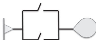
Figura 3 Ejemplo de un sistema disyuntivo

(El conector superior representa a p y el conector inferior representa a q)