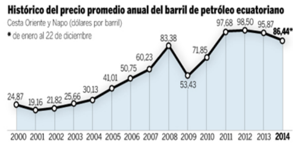
Figura 3. Histórico del precio promedio anual del barril del petróleo ecuatoriano

Pero el presupuesto registra, además, un déficit (ingresos menos gastos) de $ 5.369 millones, una situación que comenzó a aumentar desde el 2011 (en el 2012 eran $ 1.256 millones) con un precio del petróleo estable. Al déficit del 2015 se suman la amortización de deuda y la preventa petrolera a China: una necesidad de financiamiento de unos $ 8.900 millones a $ 10.000 millones, advierten analistas. Analizamos la figura 3, las cifras que van desde el año 2000 hasta el año 2014 del precio del promedio anual del barril del petróleo Ecuatoriano.