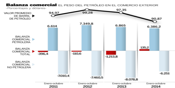
Figura 2. Balanza comercial: El precio del petróleo en el comercio exterior

Nuestro emisor, el Banco Central del Ecuador de acuerdo a sus datos que son fidedignos y evidentes, las exportaciones petroleras generaron aproximadamente $12,100 millones de dólares con un saldo para el país de casi $ 6,400 millones frente a las importaciones, que permitió marcar una diferencia y equilibrar la balanza comercial total. Analizamos en la figura 2 las cifras que van relacionadas a la balanza comercial desde el 2011 hasta el 2014.