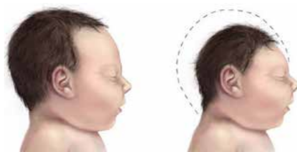
Figura 1. Ilustración de malformación física producida por la microcefalia (32). Editado por autores.

Adicionalmente, el virus además tiene la capacidad de transmitirse por vía sexual y que actualmente no hay vacunas ni tratamientos específicos para el virus, lo que ha causado cierta preocupación a la OMS y países afectados en materia de investigación y desarrollo para hacer frente al virus del Zika (31).