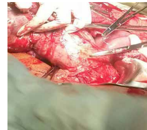
Gráfica 3. Omentectomía parcial e histerectomía subtotal