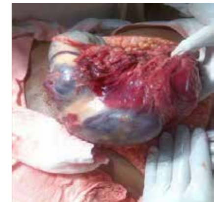
Gráfica 2. Placenta adherida a epiplon

Se remite a la paciente a la unidad de cuidados intensivos obstétricos de la institución, tiempo durante el cual presenta evolución satisfactoria sin otras complicaciones. La paciente es trasladada al servicio de hospitalización y debido a su adecuada evolución clínica posteriormente se da de alta junto a recién nacido.