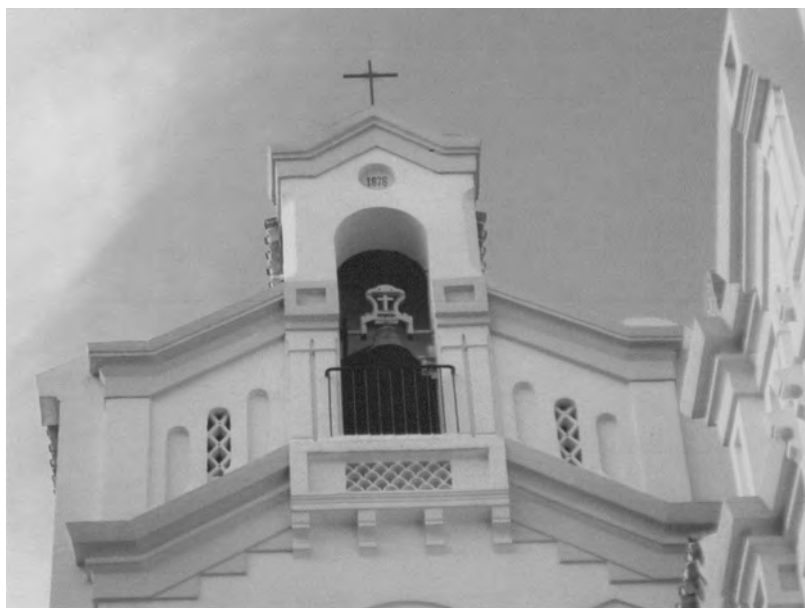
1. Iglesia Carmelitas Descalzas

Keywords: Málaga, Carmelitas, Eighteenth Century, buildings, households.