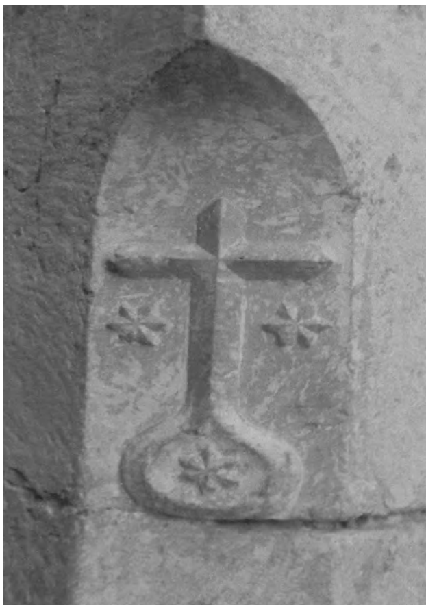
2. Cruz de las Carmelitas

posiblemente en Granada, ofreciéndole ayuda económica y el consentimiento del Obispo de la diócesis D. Francisco Pacheco, con el que tenía un parentesco familiar concediéndole con satisfacción la licencia el 6 de diciembre del año 1584.