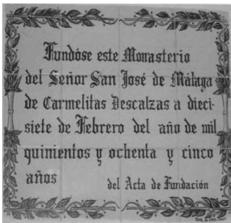
4. Acta fundacional