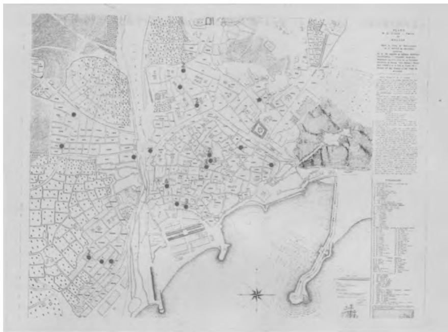
9. Mapa de las casas de 1793