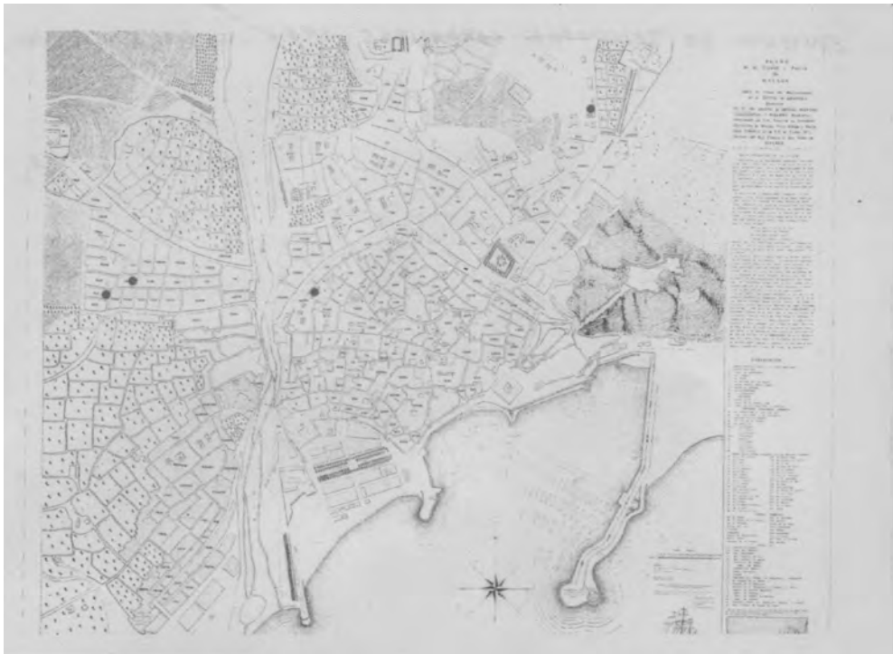
7. Mapa de las casas de 1753