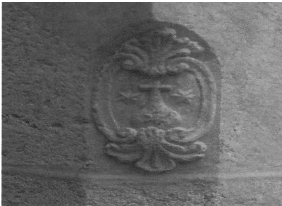
5. Escudo de la Orden de las Carmelitas

manifestando que en la calle de San Juan tenía dicha comunidad diferentes casas que habían padecido ruina con la quema de pólvora originada por el soldado que en una de ellas se alojó el 19 de febrero pasado de este año solicitando por varios fundamentos que en él se exponen se acuda por esta ciudad al remedio de semejante daño pues no podían los arrendadores habitarlas o se les franquease una ayuda de costa de 3.000r.s., con lo cual pedirían de limosna lo demás y ocurriría a repararlas, y la ciudad en su inteligencia acuerda pase dicho memorial a los caballeros diputados de Cuarteles, alojamiento y síndico del común para que se instruyan de la certeza del caso que refiere y verificada ésta hagan que por los alarifes se reconozca