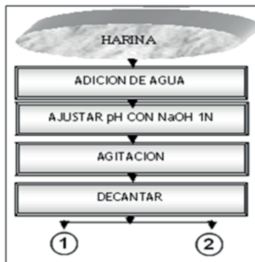
Figura 2. Línea Tecnológica para la obtención del concentrado.

min en una Centrífuga Jouan B3-11. Posteriormente las proteínas se separaron del suero por decantación, se lavaron con agua en agitación manual constante, obtenido el coágulo proteico se sometió a decantación y secado al vacío, obteniéndose el concentrado proteico. La eficacia de la extracción y recuperación de las proteínas, se cuantificó determinando el contenido de proteínas por el método de Kjeldahl [9].