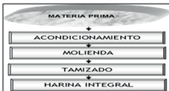
Figura 1. Diagrama de flujo de la obtención de la harina.

Se realizó método de soxhlet bajo condiciones térmicas moderadas no superiores a 40 °C, tratando de conservar las propiedades funcionales de las proteínas [9].