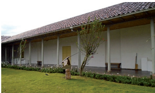
Figura 4. Jardín Museo de Arte Moderno.