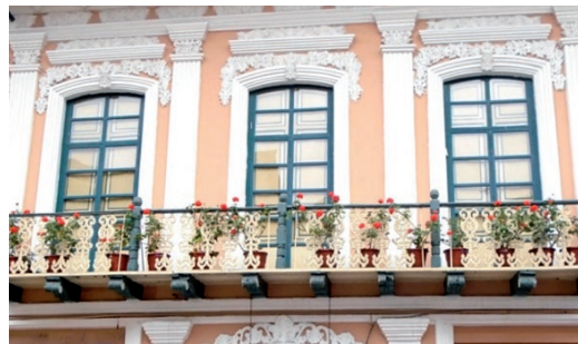
Figura 2. Balcón vivienda calle Sucre y Padre Aguirre.