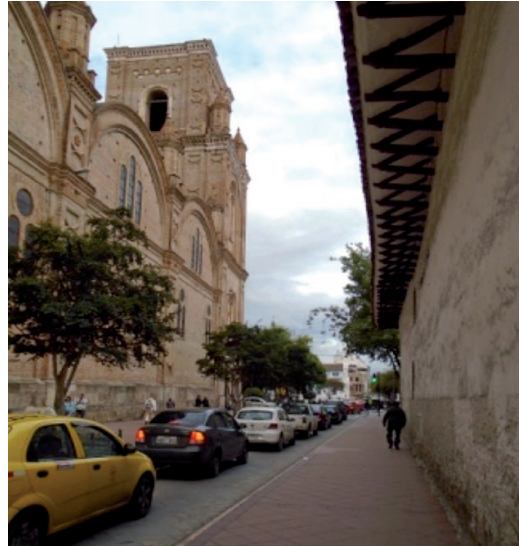
Figura 1. Detalle de la Catedral de la Inmaculada Concepción.

La vida de Cuenca dio un giro en materia cultural y patrimonial, es así que estas categorías preocupan a un número cada vez más amplio