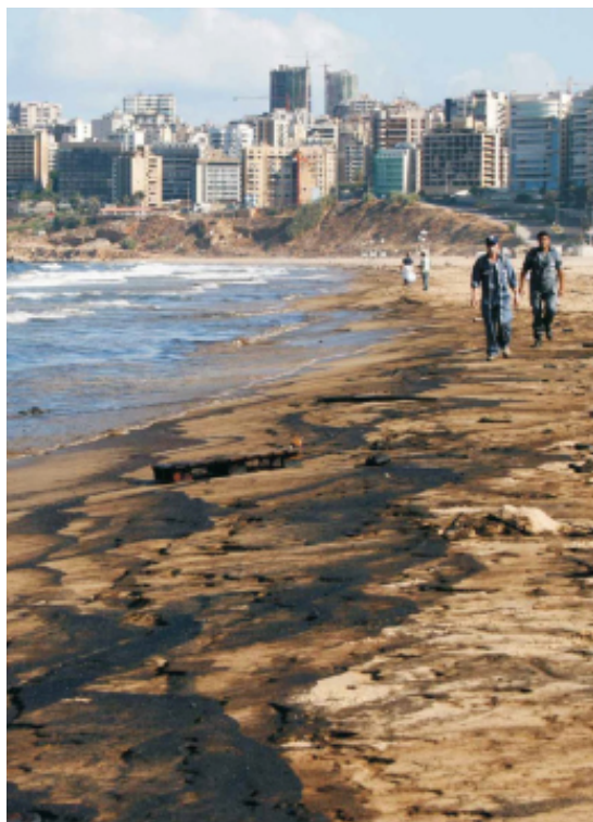
Imagen N° 4: Costa libanesa afectada por vertido de petróleo.

No obstante, dichas estimaciones no engloban los riesgos potenciales que a largo plazo puede acarrear el impacto medioambiental. Aún hoy resulta muy difícil estimar las consecuencias de la misma en términos de salud e impacto medioambiental a largo plazo, dado que debe transcurrir un período de 10 a 20 años para poder evaluar los efectos de ciertas sustancias tóxicas en el cuerpo humano. Los resultados de los informes de Naciones Unidas y del Banco Mundial (enero y octubre de 2007, respectivamente) solamente midieron las consecuencias inmediatas del conflicto en el medioambiente. 25