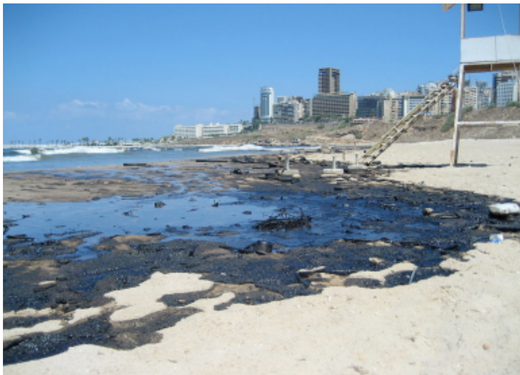
Imagen N° 2: Petr leo de la central el ctrica de Jiyeh derramado en las playas de Beirut, consecuencia del conflicto Israel-L bano, julio 2006.

Por su parte, en el art. 55, se dispone que: