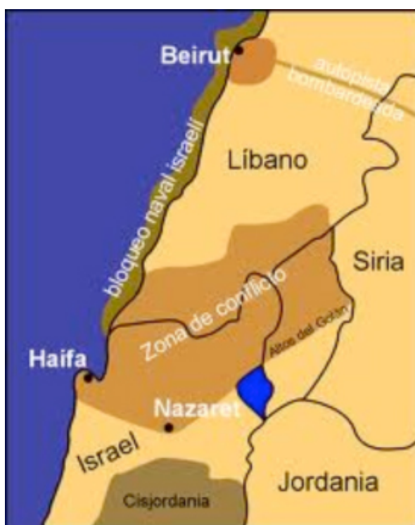
Imagen N° 3: Zona de conflicto guerra Líbano-Israel de 2006.

ración de los prisioneros árabes de las cárceles israelíes. La captura se hizo en el Sur de la República del Líbano, en un enfrentamiento que se habría producido contra fuerzas israelíes que habrían penetrado en la ciudad fronteriza de Aitaa al-Chabb, cerca de las granjas de Shebaa.