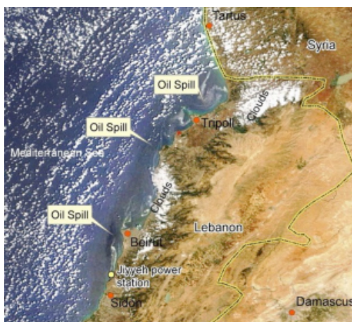
Imagen N° 5: Foto satelital de puntos de derrames de petróleo sobre costas libanesa y siria del mar Mediterráneo, 2006.

La Reserva Natural Palm Islands consta de tres islas planas y rocosas de piedra caliza erosionada y la zona marina circundante, ubicada a 5,5 km de la costa y al Noroeste de Trípoli, Líbano. El área total de la reserva es de 4,2 km 2 , designada como Zona Especialmente Protegida del Mediterráneo en el marco del Convenio de Barcelona de 1995. Las islas también fueron identificadas como Humedal Ramsar de Importancia Internacional Especial en 1980, y como un Área Importante para las Aves por BirdLife International. Las islas son un refugio para las tortugas bobas en peligro de extinción, las focas monje y para la nidificación de las aves migratorias. 29