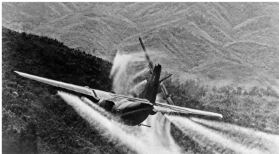
Imagen N° 1: El herbicida Agente Naranja fue esparcido en amplias áreas durante la guerra de Vietnam, con graves consecuencias medioambientales y sanitarias.

objeto alterar -mediante la manipulación deliberada de los procesos naturales- la dinámica, la composición o estructura de la Tierra (...). 15