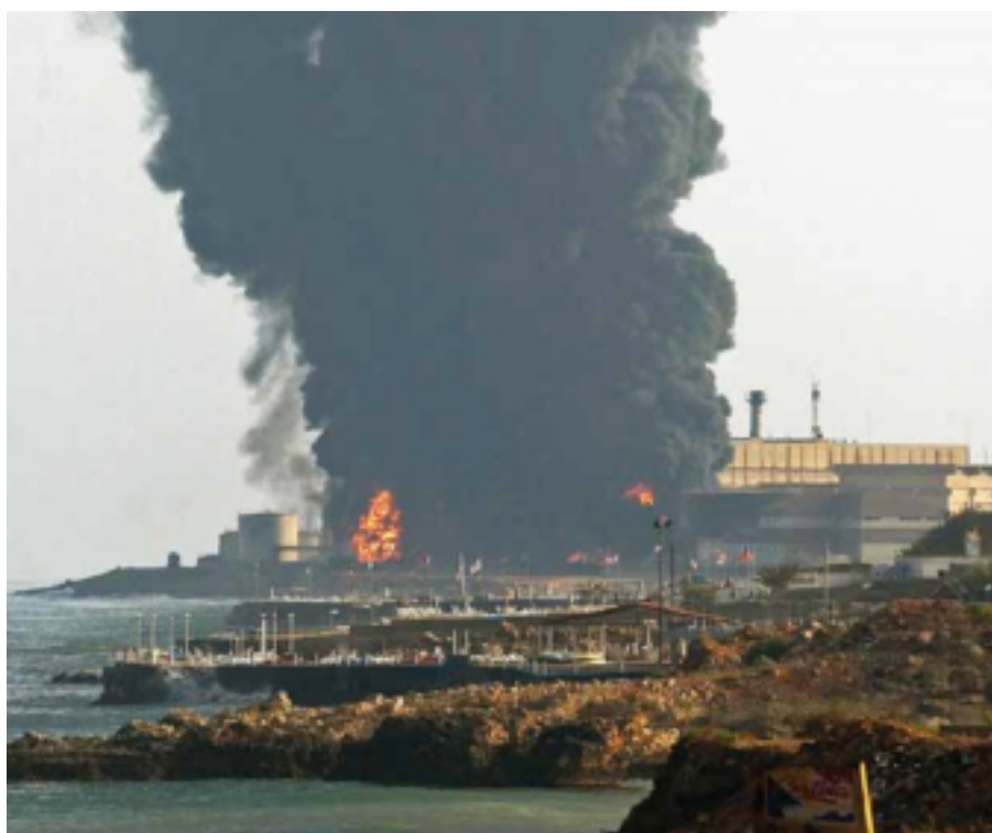
Imagen N° 7: Incendio de los tanques de petróleo en la planta Jiyeh(Líbano), julio de 2006. Entre 10.000 y 15.000 toneladas de petróleo fueron derramadas al Mediterráneo.

En otoño de 2006 se habían recogido 600 m 3 de petróleo líquido y 1.000m 3 de arena, guijarros y desechos contaminados. Además, todavía no se sabe con certeza el impacto a largo plazo que las sustancias tóxicas del vertido han tenido en la salud de personas que estuvieron en contacto directo con él y en los residentes de la zona.