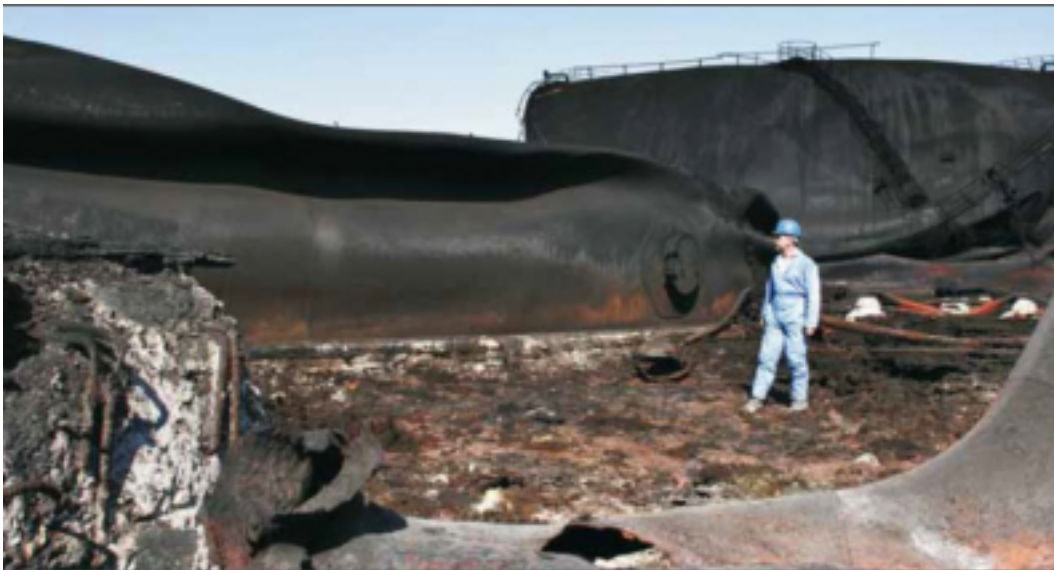
Imagen N° 6: Experto de PNUMA investigando uno de los tanques de almacenamiento dañados en la planta Jiyeh, 2007.

El PNUMA señaló que sería necesario tomar medidas urgentes para eliminar o disponer en forma segura las cenizas y químicos derramados, ya que representaban una amenaza para las provisiones de agua y para la salud pública en general.