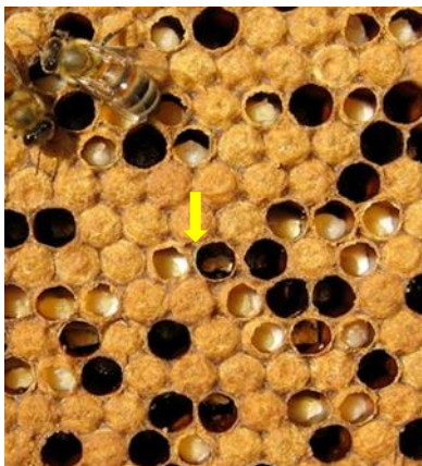
Figura II. Observación de la presencia de Ascospaera apis en el apiario de observación.

Vanengelsdorp et al. , 2009), capacidad polinizadora, hasta su reproducción y desarrollo.