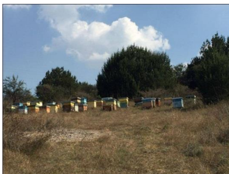
Figura I. Apiario en el Municipio de Jalostotitlán, Jalisco; donde se realizaron las observaciones de Ascosphaera apis

La apicultura en México, es una actividad de la que dependen aproximadamente 40 mil productores, quienes en conjunto poseen más de 2 millones de colmenas, lo que permite que México sea el quinto país productor y tercer exportador de miel a nivel mundial (SAGARPA, 2014). Jalisco ubicándose en el tercer lugar nacional. La producción apícola, a pesar de la presencia de la abeja Africana ( Apis mellifera scutellata ) e infestación con ácaros ( Varroa destructor ), ha registrado una importante recuperación (crecimiento anual 3%) que se ha sostenido durante los últimos 5 años, superando en los últimos 4 años, las 56,300 toneladas de miel; de las cuales se han exportado cerca de 29,109, principalmente a Europa (Alemania e Inglaterra) y Estados Unidos de Norteamérica (USA), generando ingresos por 32.4 millones de dólares anuales; lo que confirma que la apicultura es fuente de divisas (SAGARPA, 2014).