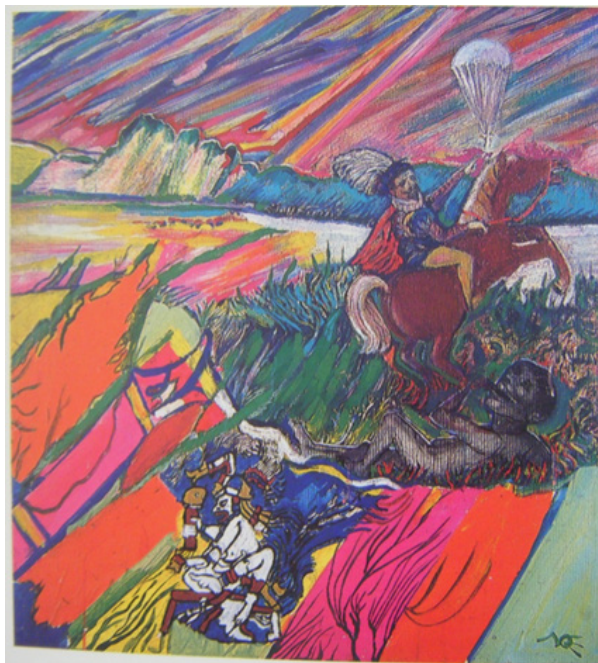
Figura 3. Luis Felipe Noé: Irrupción de la civilización occidental , 1975. Óleo sobre tela 75 x 75 cm.