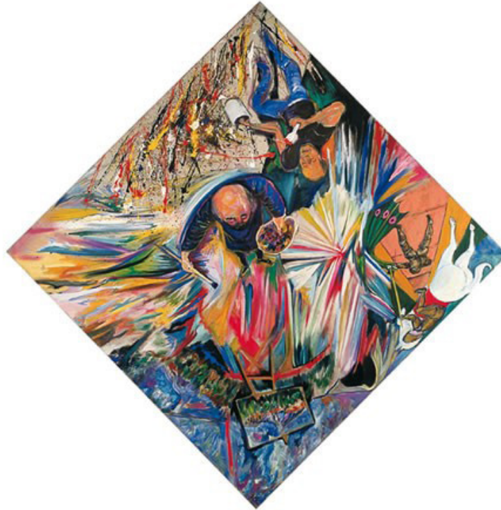
Figura 5. Luis Felipe: El espacio pictórico , 1989. Óleo sobre tela 280 x 280 cm.