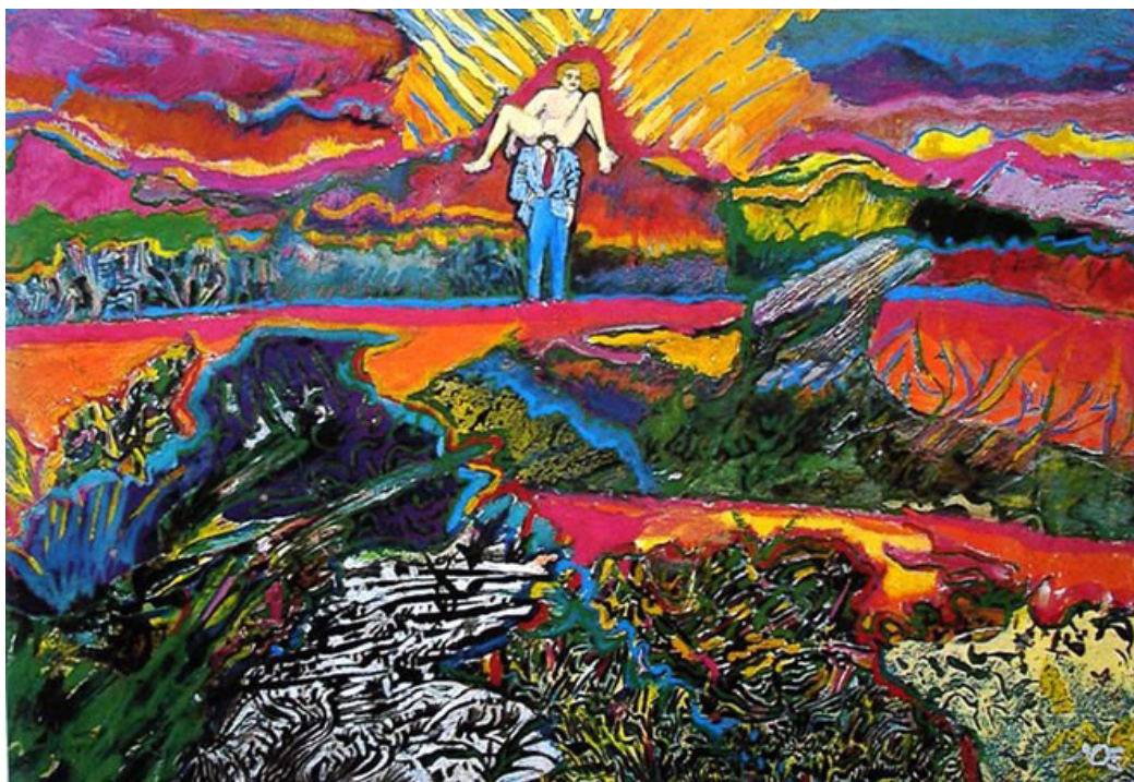
Figura 1. Luis Felipe Noé: La naturaleza y los mitos n.º IV , 1975. Técnica mixta sobre papel y cartón, 67,5 x 97,5 cm. Fuente: Luis Felipe Noé (2014).