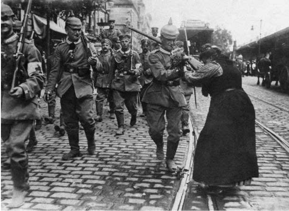
Foto en Sarajevo.

El Conflicto de los Balcanes, que se produce en un contexto de una marcada pluriculturalidad, se concibe como genocidio, porque fue juzgado como una limpieza étnica que trasgrede los Derechos Humanos, con el afán de los líderes serbios, civiles y militares, de exterminar una raza autónoma que tenía ansias de crecer y de independizarse. Fue un genocidio porque no se tuvo en cuenta el respeto al Principio de Humanidad que se profesa desde el final de la segunda guerra mundial y que busca la humanización de la guerra en el Convenio I (CICR, 1949) y II (CICR, 1949) de Ginebra, es decir el respeto al combatiente herido o enfermo, o que haya depuesto las armas.