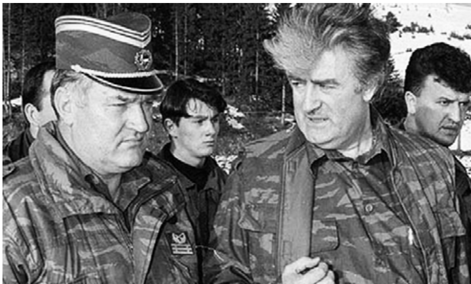
Ratko Mladic, con Radovan Karadzic en Vlasic en abril de 1995.

La vulneración a los lineamientos básicos del Derecho Internacional Humanitario, cuando estos han sido definidos de manera conjunta por la mayoría de los Estados, pensando en la protección de las víctimas, de las personas, de los bienes protegidos y de los combatientes, es el inicio del deterioro de la comunidad global y sus generaciones venideras, dado el respeto que se debe propender por lo que en algún momento se consolida de la unión de los gobernantes que ellos mismos han elegido.