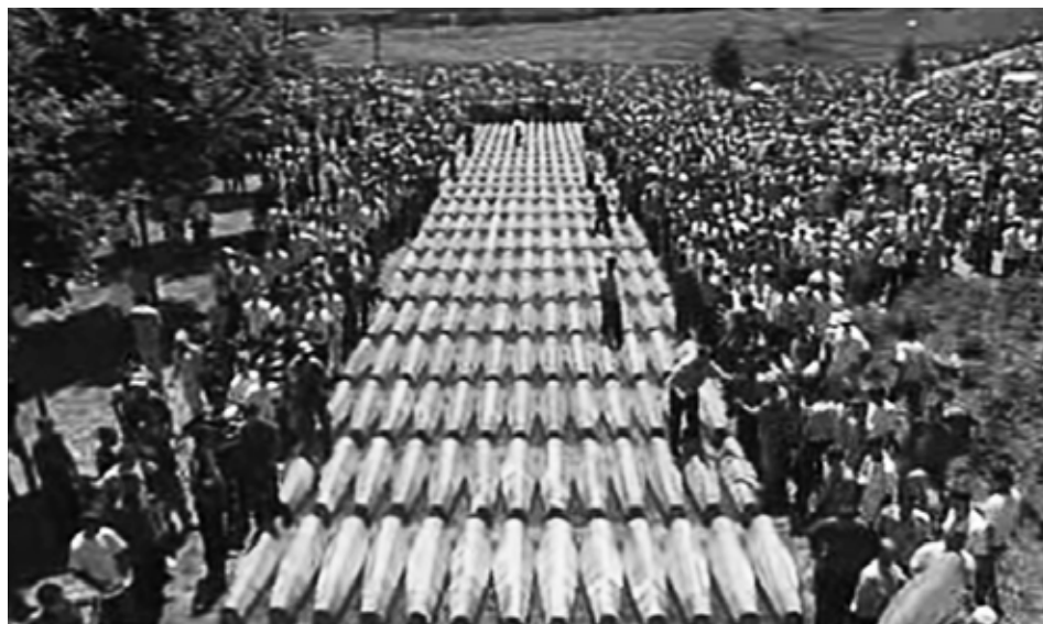
Foto en Srebrenica de la Televisión Española (tve).

Es necesaria la consolidación de un futuro de respeto y protección a las personas y a los bienes protegidas en un conflicto armado, ya sea de carácter internacional o interno, como sustento de la comunidad global, y se asegura la buena fe de los Estados miembros, al escoger representantes dignos en lo que se ha vislumbrado como la realidad y existencia de los llamados Derechos Emergentes, y de la paz.