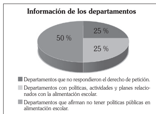
Gráfica 1. Consolidado de respuestas de departamentos

El consolidado de la información indica que el 25 % de los departamentos no contestó los derechos de petición; el 50 % de los departamentos respondió señalando que no tiene políticas públicas, planes, programas o actividades asociadas con la alimentación escolar; y el 25 % de los departamentos restantes, manifiesta que a pesar de no tener una política pública específica, sí desarrolla actividades o ha implementado estrategias para promover los hábitos de alimentación saludable en su territorio (véase gráfica 1).