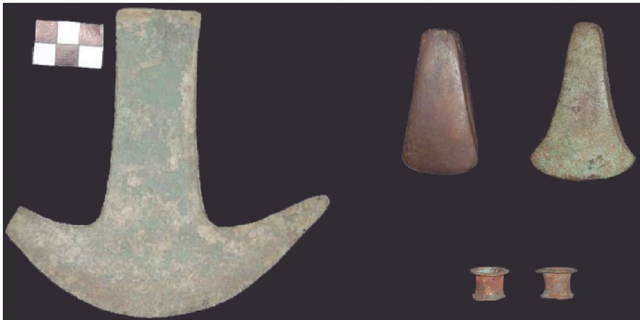
FIGURA 2. Artefactos de cobre hallados en Moxviquil: un hacha-moneda, dos hachas miniaturas y dos orejeras.

varrete, 1966: 35, 37). La colección de Chiapa de Corzo también comprende un hacha de cobre en miniatura, un hacha-moneda de cobre y dos orejeras pequeñas que son idénticas en forma a las recuperadas de Moxviquil (Navarrete, 1966: 84, 85, 87, figura 95.). Otros artículos de metal que no se han encontrado en los sitios del Valle de Jovel incluyen un cincel estrecho o lanceta, un anillo o brazalete de cobre dorado, una aguja de cobre, dos láminas de oro y un cascabel-efigie Tláloc (Navarrete, ibid. , 83). Un solo cascabel con labio reforzado fue recuperado de Acala, al este de Chiapa de Corzo, que fue ocupada por los chiapanecas por este período ( id. , figura 94c.).