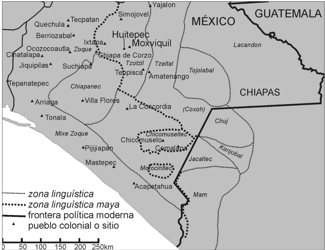
Mapa 1. Zonas lingüísticas de Chiapas (Según Calnek, 1988: Figura 2).

Examinamos la interacción a través de esta frontera cultural, tomando información del “Proyecto Económico de los Altos de Chiapas”, llevado a cabo en 2009 1 y cuyos resultados incluyen la tesis doctoral de Paris (Paris, 2012) y dos artículos en revistas especializadas (Paris, 2014; Paris y López Bravo 2012). Los trabajos de campo incluyeron nueve meses de mapeo, muestreo extensivo, excavaciones de prueba y análisis en los sitios arqueológicos de Moxviquil y Huitepec, en el Valle de Jovel de los Altos de Chiapas. Nuestro estudio también incluye nuevos análisis de materiales y de notas de campo de las excavaciones de Frans Blom y Clarence Weiant en el centro monumental de Moxviquil en 1952 y 1953 (Blom, 1954, 1958; Blom y Weiant, 1954; Paris, Taladoire y Lee Jr., 2011, 2015). 2