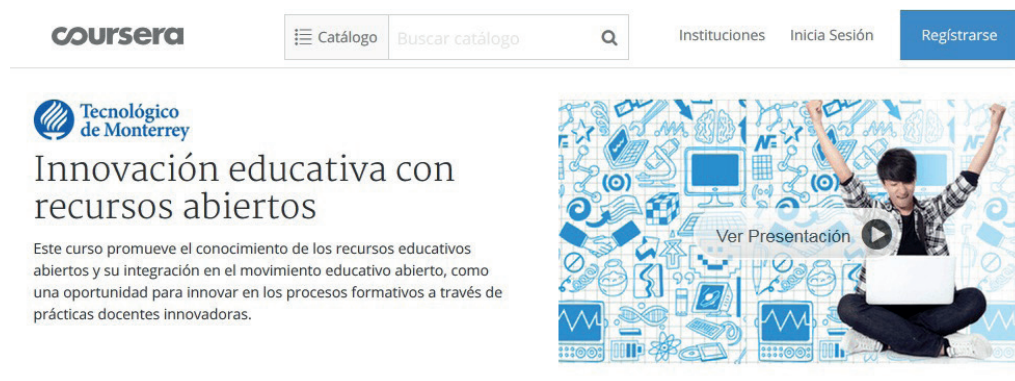
Figura 1. Portal MOOC Innovación Educativa con Recursos Abiertos

El evento de capacitación tuvo una duración de cuatro semanas, fue dirigido por dos profesores titulares y contó con el apoyo de dos docentes coordinadores y un grupo de 800 voluntarios facilitadores de aprendizajes o Teacher Assistants (TA), estos últimos seleccionados del total de 20,400 participantes inscritos. El estudio partió de la interrogante: ¿Cómo se correlaciona el uso de tecnologías y herramientas de acceso abierto con la percepción de los participantes en un curso masivo en línea para conectar sus aprendizajes?