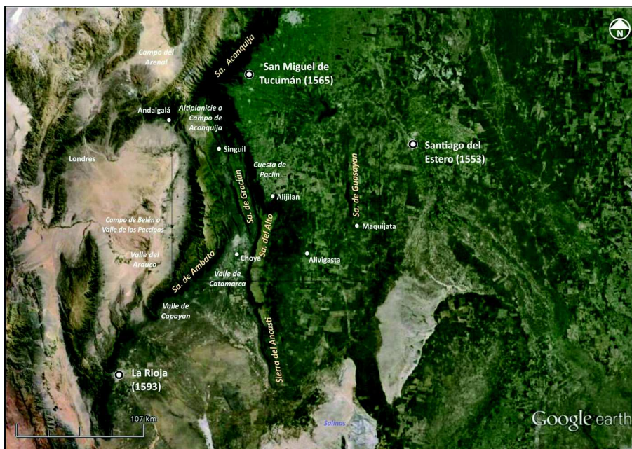
Mapa I: La Sierra de Santiago y el Valle de Catamarca

“En cuatro pueblos que hay desde donde se juntan las sierras de Londres [Ambato] y ésta [Ancasti-Alto] con otra sierresita para arriba [Gracian], que aunque es doctrina del valle hace angostura y luego ensancha dicho valle arriba hasta el pueblo de Gines de Lillo [Singuil] que todo se intitula Catamarca, que aunque he dicho a Vuestra Señoria no haber más de doce leguas, se entiende de lo angosto [hacia] abajo, que de allí [hacia] arriba hay otras catorce de mala tierra de andar porque se pasa un río veinte y dos veces para ir a estos cuatro pueblos y con las muchas aguas de este año no he podido pasar [...] y ahora he de entrar por la parte de Tucuman [cuesta de Paclin] porque el dicho rio no se puede andar parte de abajo...” 24