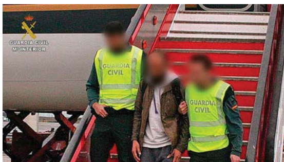
Figura 1. Ciudadano español detenido el pasado mes de noviembre cuando se disponía a viajar a Siria (Fuente: RTVE).

otros rasgos que lo distinguen de lo establecido en épocas pasadas. Mientras que en otros conflictos la movilización era –prácticamente– limitada a países del entorno o en los que predomina la religión musulmana, en la actualidad muchos Foreign Terrorist Fighters (FTF) (nombre con el que ha sido rebautizado el fenómeno por su marcado carácter terrorista) proceden de estados occidentales. Entre estos se encuentran diversos países de la Unión Europea, entre los que cabe destacar a Francia, Alemania o Reino Unido.