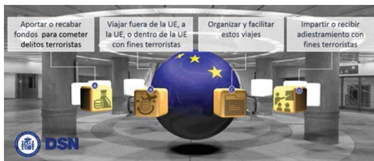
Figura 2. Esquema de la nueva normativa realizado por el Departamento de Seguridad Nacional.

en las plazas de Siria e Irak resulta cada vez más evidente, hecho que favorecerá durante los próximos meses el intento de regresar a su país de partida de un significativo número de desplazados. Aunque la amenaza para España (integrada en el espacio Schengen) no procede únicamente de los desplazados desde su territorio cabe señalar que, de acuerdo a las últimas cifras publicadas, se han identificado a 208 españoles o extranjeros residentes en España que han viajado a Siria o Irak, entre los cuales hay 46 muertes confirmadas y 32 han regresado a Europa. ■