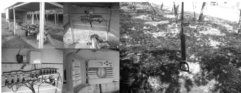
Figura 3 - Sistema mecanizado de irrigação e aspersor utilizado na irrigação dos parreirais