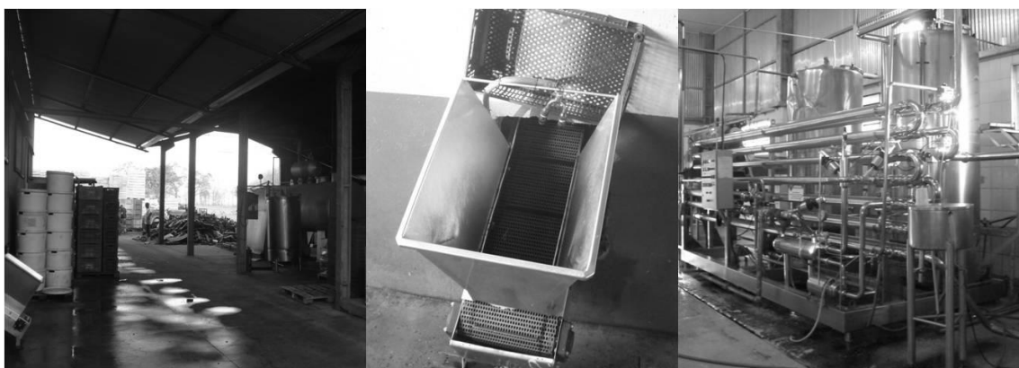
Figura 5 - Ambiente externo da fábrica (à esq.), janela de inserção da matéria-prima e embalagens (centro) e ambiente interno da fábrica durante limpeza (à dir.)

Dessa forma, os proprietários decidiram realizar uma série de inovações de processos, que atendessem aos quesitos necessários para o reconhecimento da qualidade, tais como o uso eficiente da água – encontrava-se em fase de construção uma miniestação de tratamento de água, com o objetivo de tratar grande parte da água utilizada no processo de industrialização – e a mínima utilização de produtos químicos – que são avaliados durante a auditoria. Para maior controle quanto à contaminação no processo produtivo, também se construiu um orifício de acesso que interliga a parte externa e interna da fábrica para movimentação da matéria-prima, das garrafas de vidro utilizadas como embalagem e do descarte dos resíduos, o que resultou em uma significativa redução da entrada de funcionários no interior da fábrica, como mostra a Figura 5.