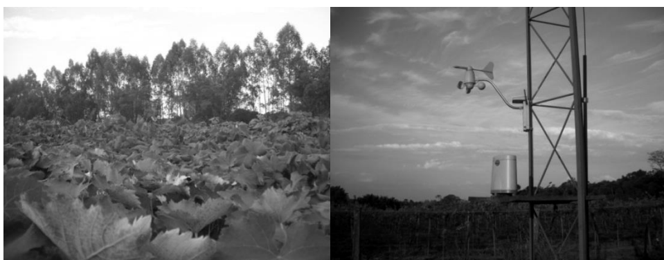
Figura 4 - Efeito 'quebra-vento' dos eucaliptos cercando os parreirais e anemômetro

Como é comum no plantio da uva, a Melina conta com um planejamento microclimático, chamado quebra-vento, cercando os parreirais por uma plantação de eucaliptos. Atrrelado a esse mecanismo natural de defesa, em um ponto estratégico da fazenda, há a instalação de um anemômetro que auxilia na mensuração da velocidade do vento, para que as medidas de proteção possam ser tomadas. O quebra-vento e o anemômetro podem ser vistos na Figura 4.