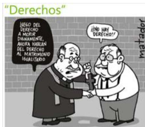
Caricatura 7. Derechos

Si se busca realizar un ejercicio de lectura argumentativa se debería tener en cuenta que las entidades promotoras de salud, o EPS, son el eje del sistema de salud del pueblo colombiano. En esta oportunidad el título de la caricatura solo permite anticipar la temática la cual activa en la mente de los lectores colombianos los problemas asociados a las dificultades para acceder a un servicio de salud digno. Es en el plano de la imagen y el texto que la acompaña que se refuerza el argumento. Allí aparece representada la EPS –a través de un médico– como institución la cual informa a un usuario la negativa de la autorización para un examen médico; se aprecia entonces que el usuario ha muerto en el intento de lograr obtener un servicio al que tiene derecho y por el que ha pagado mensualmente como trabajador. Esta imagen pone en evidencia el papel del adjetivo de estas instituciones “ser promotoras”, en sí mismas ellas no prestan un servicio, lo gestionan a través de redes de hospitales y clínicas. Esta modalidad de gestor del servicio da cuenta del alto grado de corrupción de dichas entidades en las cuales la salud se convirtió en un negocio que llena sus arcas; la salud dejó de ser un derecho humano fundamental, por tanto, la vida se convierte en un valor mercantil más. En consecuencia, la tesis sería: las personas que requieren de tratamiento médico por parte de una EPS mueren antes de lograr un trato digno.