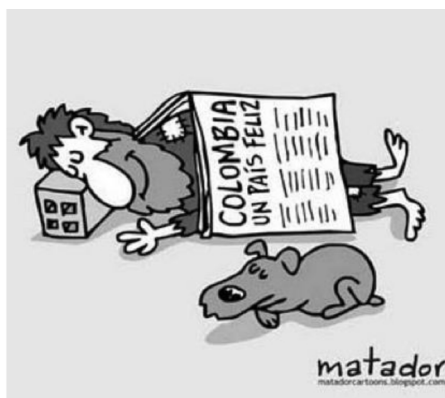
Caricatura 3. Colombia el país más feliz del mundo