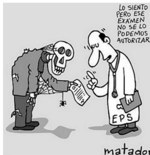
Caricatura 4. EPS

cuyo titular retoma el estatus de Colombia y sus altos índices de felicidad frente a otros países. En este caso la tesis sería: es contradictorio que Colombia sea el país más feliz del mundo cuando existen altos niveles de desigualdad social entre sus habitantes . Además, se cuestiona al lector de la caricatura desde la ironización de lo que entendemos por felicidad. Si esta emoción depende de un alto nivel de expectativas, no sería posible decir que alcanzamos la felicidad; por el contrario, si se baja dicho nivel de expectativas podríamos ser felices con cualquier cosa. Este es precisamente el caso colombiano.