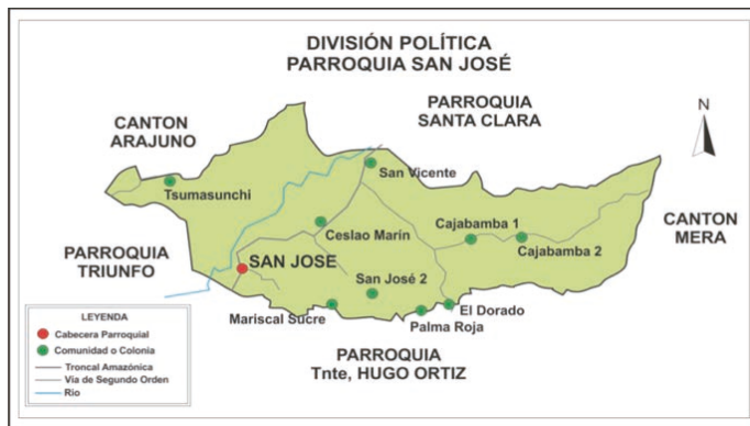
Figura 2: Mapa político del GAD de la parroquia rural San José

Tsumashunchi; entre las que se destacan San José y San Vicente, como las parroquias en las que más se desarrollan los proyectos de emprendimientos agropecuarios (Ver figura 2).