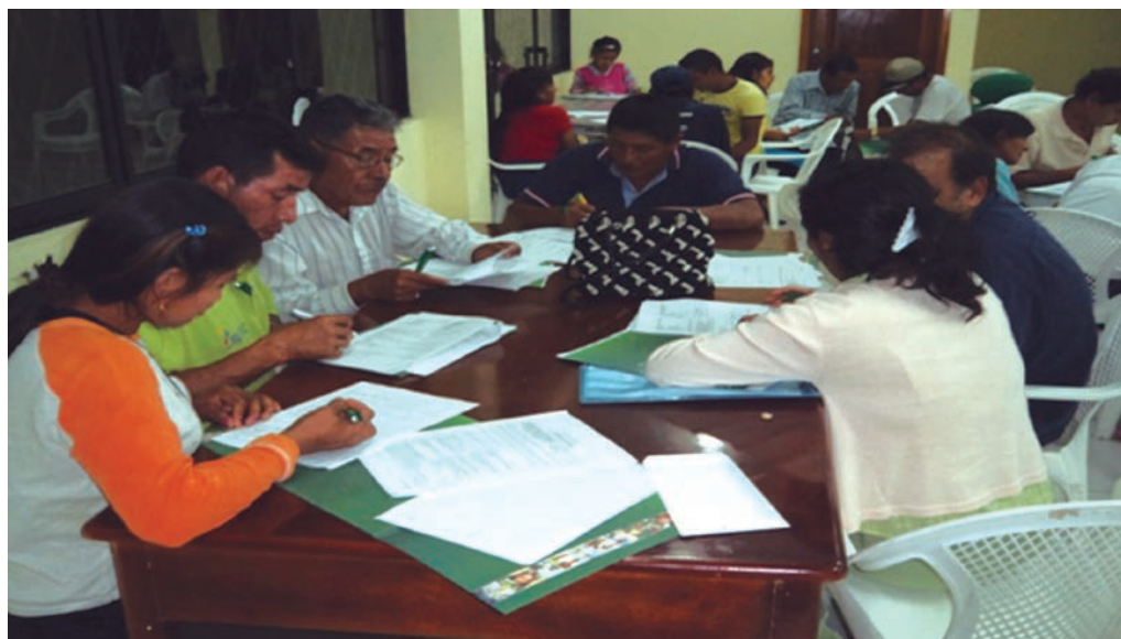
Figura 3: Talleres participativos

emprendimientos que se desarrollan en las localidades del GAD de la parroquia rural San José: presidente, secretario y tesorero, siendo estos actores directos en la investigación. El criterio de selección de los dirigentes se basó, en que estos son los responsables de la administración de dichos proyectos de emprendimientos. Como resultado de estos talleres se elaboró una encuesta. A fin de validar la encuesta y elaborar la definitiva para su ulterior aplicación, se realizó una prueba piloto con 25 dirigentes, para finalmente aplicar la encuesta a los 75 directivos.