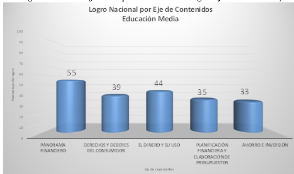
Figura 2: Porcentaje de respuestas correctas según eje de contenidos)