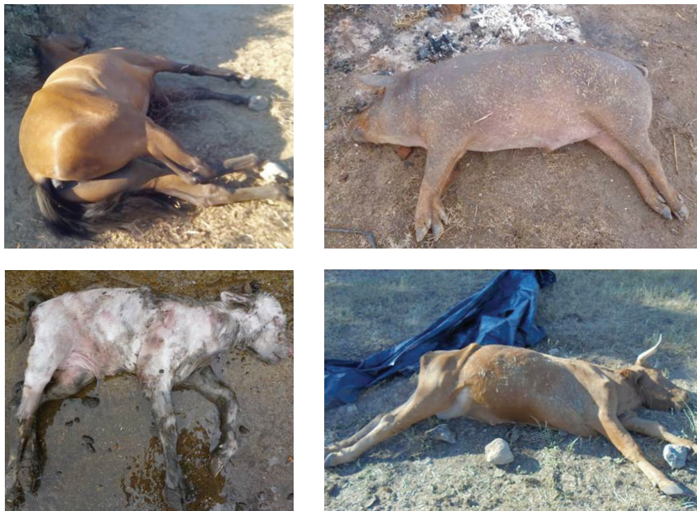
Figura 1. Mortalidad de una explotación agropecuaria (caballo, cerdo, vaca y aborto)