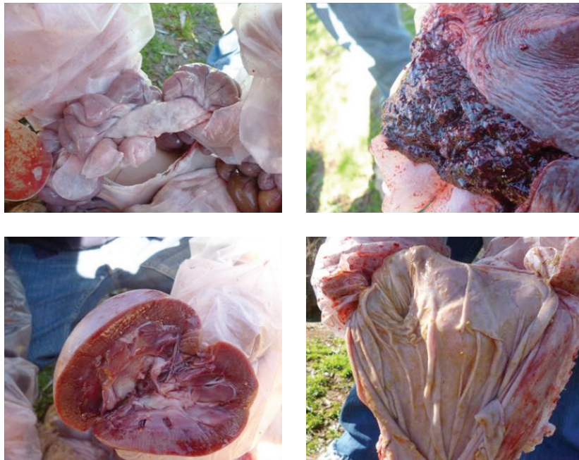
Figura 7. Técnicas de necropsia a campo: examen macroscópico de órganos (Intestino delgado y nódulos mesentéricos, bazo, riñón y abomaso)

cia el colon, despegando la adherencia que la dilatación gastriforme del colon y la base del ciego tienen con el saco epiploico, con el riñón y con el páncreas (figura 7). Se corta la vena porta y la raíz mesentérica posterior. Se desprende por tracción el colon y el ciego de su fijación; las últimas adherencias de la base del ciego, la dilatación gastriforme y los órganos circundantes se desprenden. Se extrae el bazo, incidiendo el ligamento espleno-renal y el epiplón que lo une a la gran curvatura gástrica; se extrae el estómago cortando los ligamentos de la curvatura y el hepato-gastro-diafragmático; luego, tirando hacia atrás el órgano y la abertura esofágica del diafragma, se corta; se extrae el hígado mediante una incisión ligamento y adherencias con el riñón (7,10).