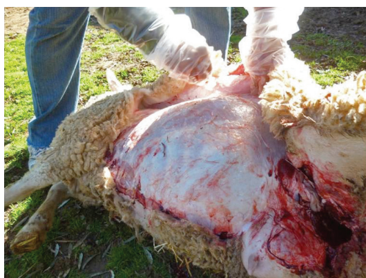
Figura 2. Técnicas de necropsia a campo: oveja desollado

menudillo, terminando circularmente en el tercio inferior de los metatarsianos. Cuarto corte : alrededor de la boca por detrás de la comisura de los labios. Alrededor de los ojos y de las orejas. Una vez realizados los cortes anteriores se procede a separar la piel del resto del cuerpo. Se observa en su cara interna el tejido subcutáneo; se inspecciona el tejido muscular superficial del cuerpo y los ganglios linfáticos superficiales (10).