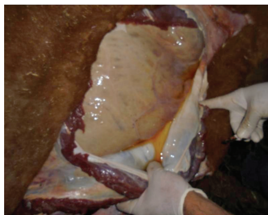
Figura 3. Técnicas de necropsia a campo: toro apertura de la cavidad abdominal

Se aborda realizando una incisión profunda, siguiendo el borde caudal de la última costilla hacia la línea media (esternón) (10,11). Se introducen los dedos índice y medio de la mano libre en la cavidad abdominal (peritoneal) y se abren en forma de v , en cuyo vértice se apoya el lado del cuchillo (7). Observe el contenido de la cavidad abdominal (peritoneal) y el estado de parte de algunas vísceras del abdomen. Corte de la pared abdominal izquierda: desde la región púbica hasta la región lumbar, ambos perpendicularmente. Se levanta el colgado y se lleva hacia el hipocondrio; luego se cortan los procesos lumbo-costales y se observa su cara interna; se examinan los órganos en su sitio, tal como estaban en el animal vivo; se palpa el diafragma que normalmente es tenso, proyectado hacia delante y brillante (figuras 3, 4 y 5).