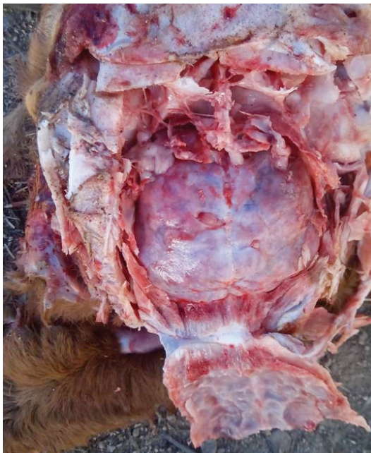
Figura 8. Técnicas de necropsia a campo: becerro apertura de la cavidad craneana

Se debe separar la cabeza del cuello por corte de la cápsula articular occipito-atloidea y la masa muscular de la región. Se hace corte sagital de la cavidad craneana, hueso frontal y nasal (figura 8). Para observar los hemisferios cerebrales, senos cornetes y meatos, se debe extraer el encéfalo, así como la médula espinal en todas sus secciones: cervical, torácica, lumbar, cauda equina y nervios periféricos (13).