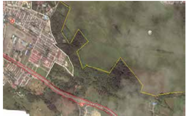
Fig 1. Humedal Coroncoro: Zonas Verdes

El Humedal Coroncoro, se encuentra ubicado en el barrio Manantial (Villavicencio, Meta-Colombia), es el refugio de muchas especies, tiene una extensión de 30.2 hectáreas entre su área de delimitación y la zona de amortiguación. El tejido urbano presente en los alrededores del humedal es continuo, se define como espacios conformados por edificaciones. Las edificaciones, vías y superficies cubiertas artificialmente cubren más del 20% de la superficie del terreno, lo que hace percibir un maltrato al interior de los recursos presentes en el humedal, Fig 1.