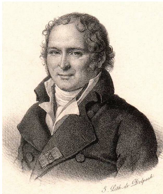
Figura 3. Antoine-François Fourcroy (1750-1809).