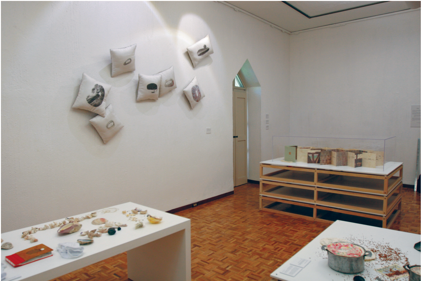
FIGURA 1. Exposición Desde y para la memoria . Ioulia Akhmadeeva, 2015.

contemporáneas, así como con la recuperación de testimonios de la libreta de comentarios de la muestra y las entrevistas que, en marzo del 2016, se les hicieron a tres jóvenes estudiantes de historia del arte en la Escuela Nacional de Estudios Superiores (ENES)-Unidad Morelia, de la Universidad Nacional Autónoma de México (UNAM), de entre 19 y 22 años de edad, que acudieron a la exposición. Dos de ellos son originarios de la Ciudad de México, aunque radican en Morelia por razón de sus estudios, mientras que el tercero es oriundo de esa ciudad. El guión que sirvió para interrogarlos retoma metodología reciente de la antropología lingüística que ha postulado la diversificación del tradicional esquema pregunta-respuesta de la entrevista con dispositivos de interacción con las personas que las inviten a hacer actividades en las que despliegan o expresan lo que les es significativo del fenómeno estudiado (cfr. Ochs y Schieffelin, 1997:251-260; Duranti, 2000:377-421; Goffman, 1983:128-157; Foley, 1997:3-25). Con base en tales premisas, en la interacción con los estudiantes se trataron los siguientes aspectos: 1) recrear una explicación para alguien cercano del núcleo “Muerte y pacifismo”; 2) generar tres frases de apreciación de los proyectos del núcleo, a saber: Bukvar , Libro híbrido y Día de conocimiento ; 3) reflexionar sobre la relación entre los materiales de archivo y los proyectos re-