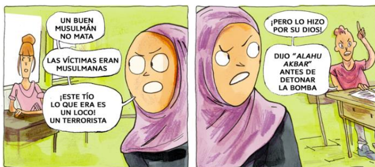
Imagen: Dos viñetas de Las afueras.