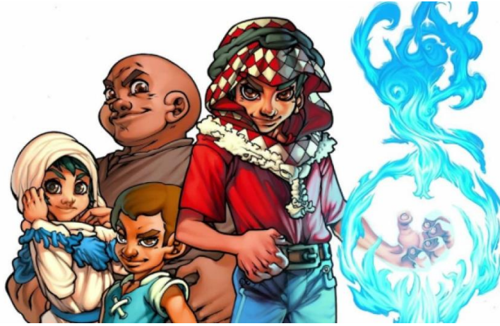
Imagen: Algunos personajes creados por Bakhit.